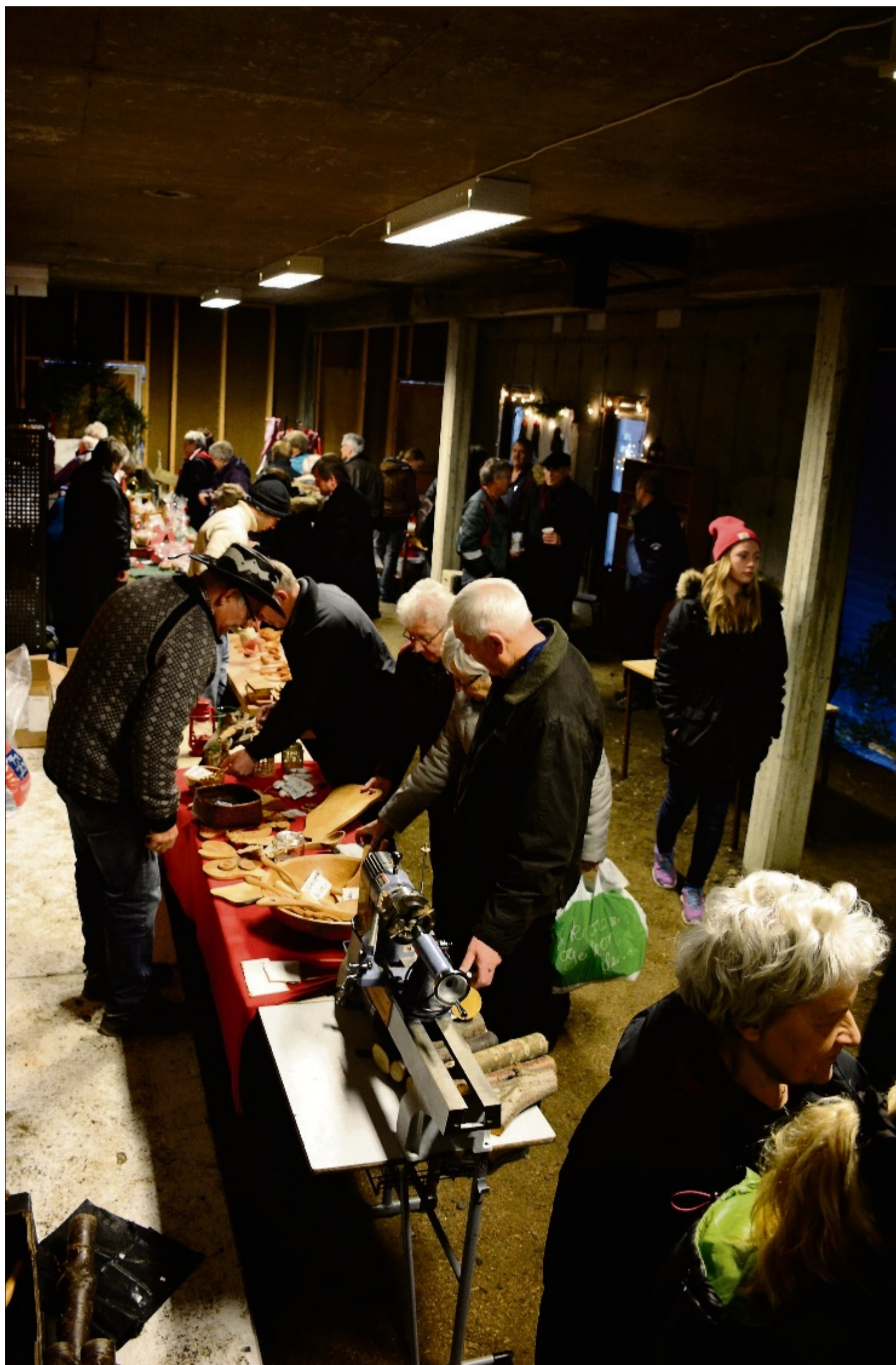
Folksomt: Mange hadde tatt turen til Frænabu for å handle julevarer, mat og gaver.

var vi på adventsfest som ble arrangert for frivillige og ansatte. Og i dag har vi kjøpt mye bakst. Vi er helt blakke nå. Det er bra vi har bom-kort på Atlanterhavstunnelen, sier de.