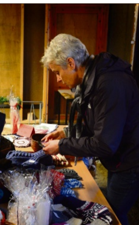
Eide sikret seg julegaver fra strikke-