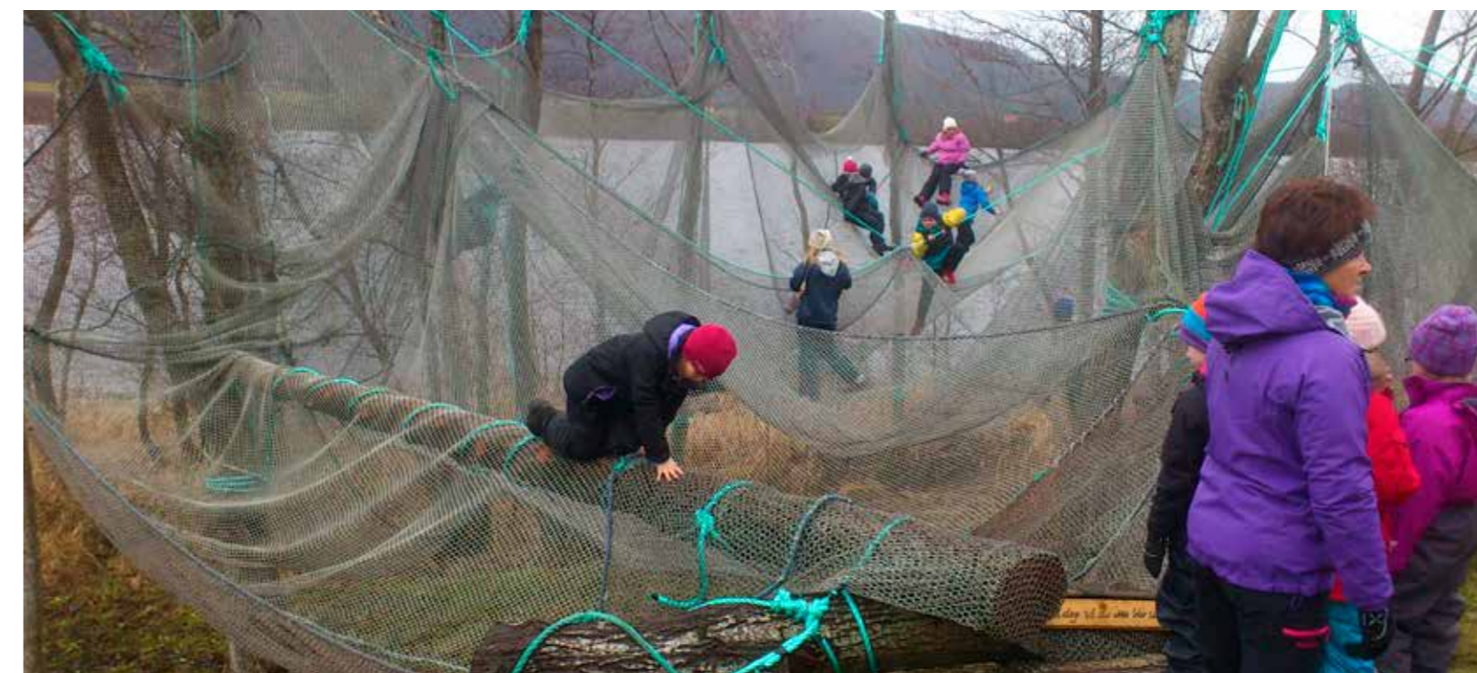
Hinderløypen var en suksess på adventsleiren i år. Både små og store hadde mye morro der!

29.november – 1.desember var 53 deltagere + ledere samlet til adventsleir på Frænabu.