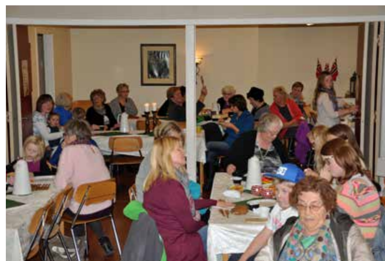
Det var helt fullt av folk på bedehuset under messen.

Lørdag 2 november var det på nytt Før-Julsmesse i Kårvåg bedehus.