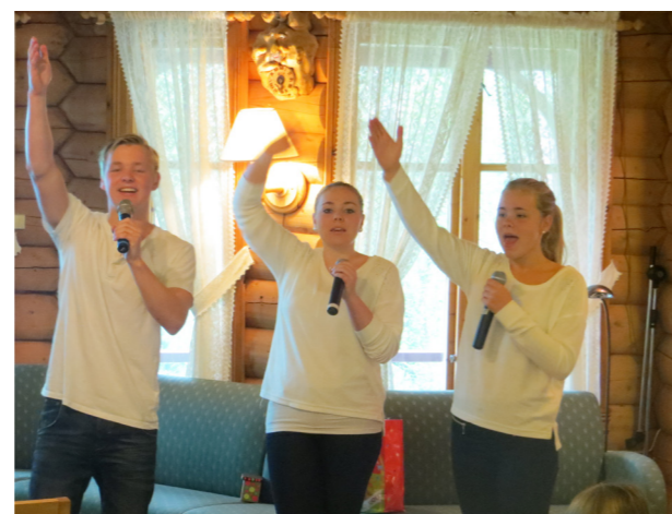
Team Sulebakk var med å sang for oss på familieleiren.

Takk for en kjempehelg på Visthus og velkommen igjen på neste familieleir!