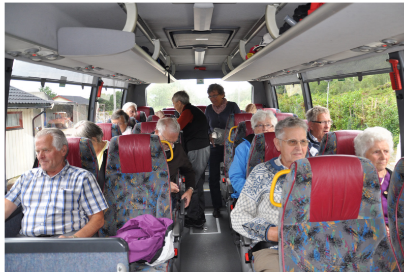
7. – til 11. august var vi igjen samlet til leir for 55+.