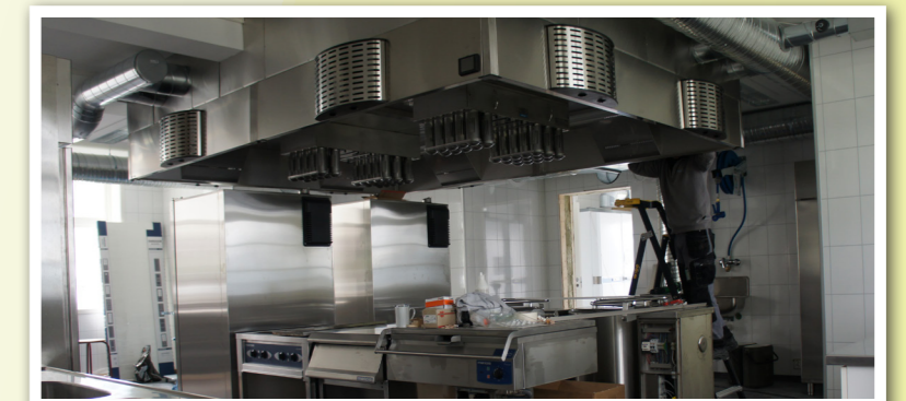
For tiden har Høgtun Møre og Romsdals nyeste og flotteste kjøkken.

På ettermiddag ble gymsalen fylt med forventningsfulle elever og foresatte, omlag 300 var samlet. 11 utlendinger fra USA, Canada, Kenya, Tyskland, Hviterussland, Ecuador, Albania og Nederland. Av norske elever kommer de fra Kristiansand i sør til Bardu i nord. Med det gode været ble det en kjempeflott tur på søndagen. Til Orsetsætra, Nøssa og Reinsfjellet. Mange slitne og fornøyde elever var å se ved middagen på ettermiddagen. Vær med å omslutte elevflokkene i omtanke og forbønn!