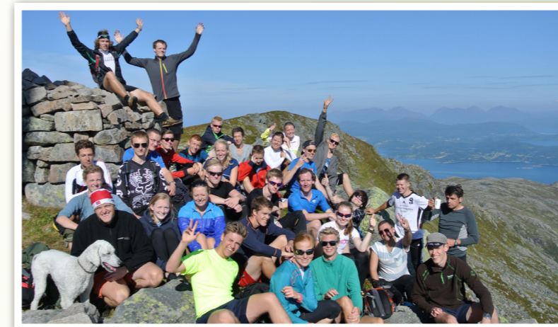
Mange av elevene kom seg på Reinsfjellet.