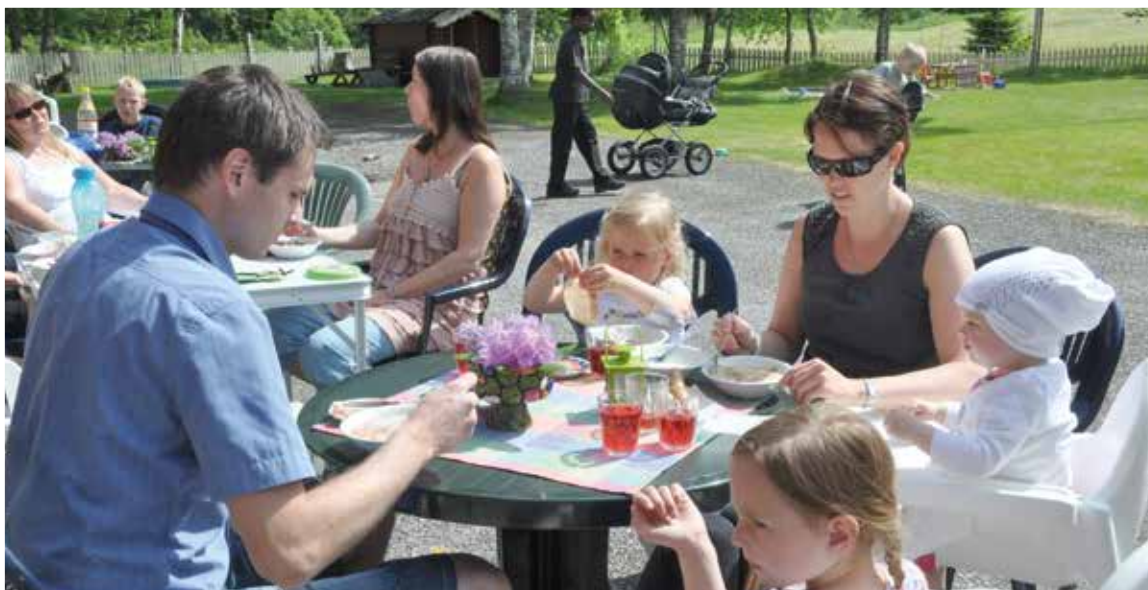
Små og store koste seg i finværet på Visthus søndag 16. juni. Du finner flere bilder på hjemmesiden: www.nri-imf.no .

Nydelig sommervær skapte en flott ramme rundt årets Midtsommerfest!