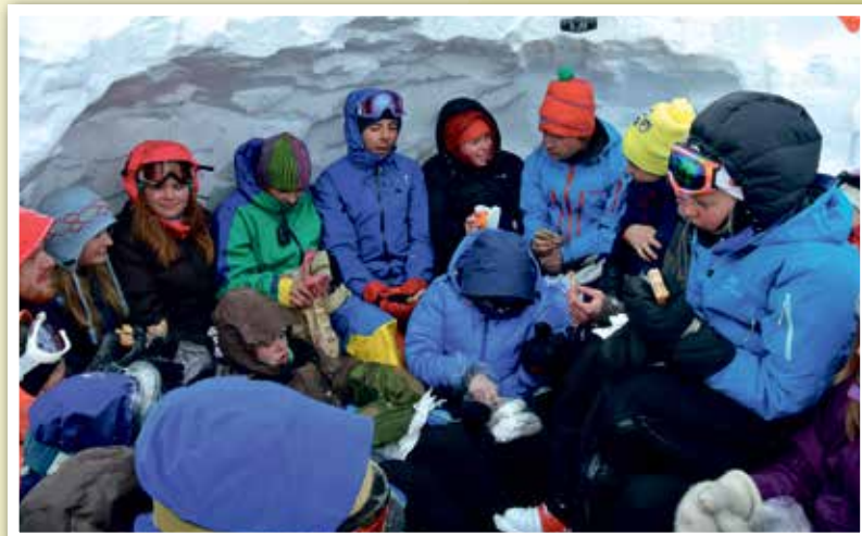
På tur til Goksøyra ble været ganske dårlig, og klassen bestemte seg for å grave seg ned i en stor skavel. Slik kunne vi ha lunsj i ly for vinden