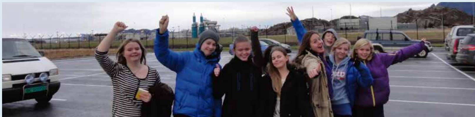
Tur til Nyhavna, Gossen

I adventstida har vi ved Romsdal Ungdomsskole fokus på mange ulike ting. Det faglige med lekser og juletentamener må gå sin vante gang. Samtidig retter vi blikket bort fra skolen og vår egen komfortable hverdag – med en omvendt julekalender. En inn-