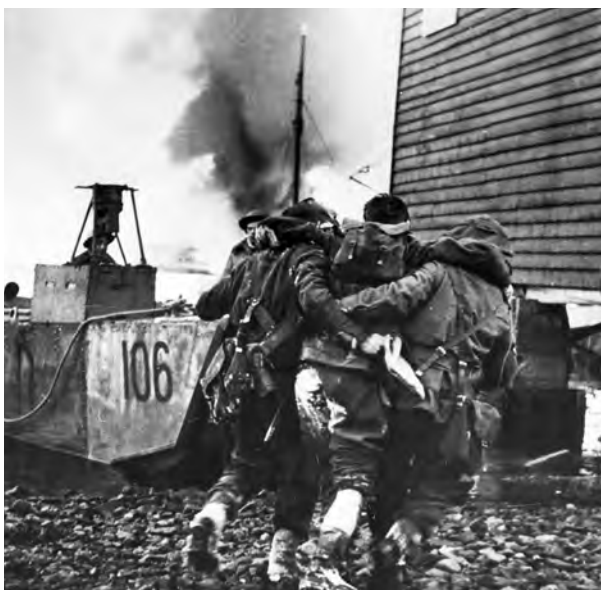
AKSJON: Kommandosoldater i Kompani Linge i aksjon i 1944 på ukjent sted, med landgangsboat og såret soldat.