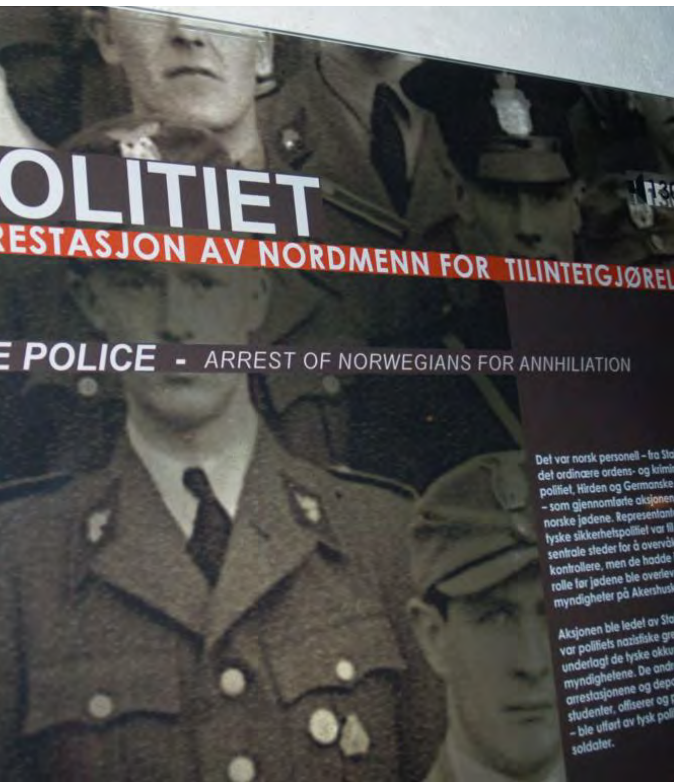
...em til slaveskipet «Donau» i Oslo. Først da de var ombord, overtok tyske SS-soldater kommandoen. Utstilling fra HL-senteret i Oslo.