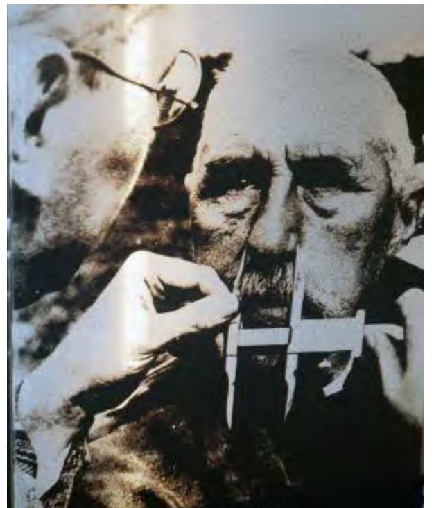
RASEUNDERSØKELSE: Jøder måles under en raseundersøkelse. Utstilling fra HL-senteret i Oslo.