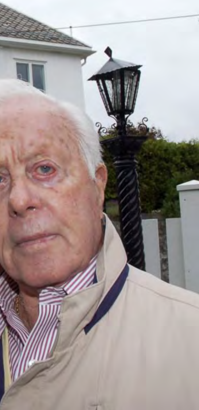
mann. Her står han foran sitt barndomshjem på Nordstrand i Oslo.