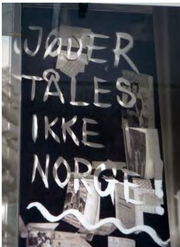
JØDER TÅLES IKKE: Dette antisemittiske budskapet er skrevet på et vindu i krigsårene.