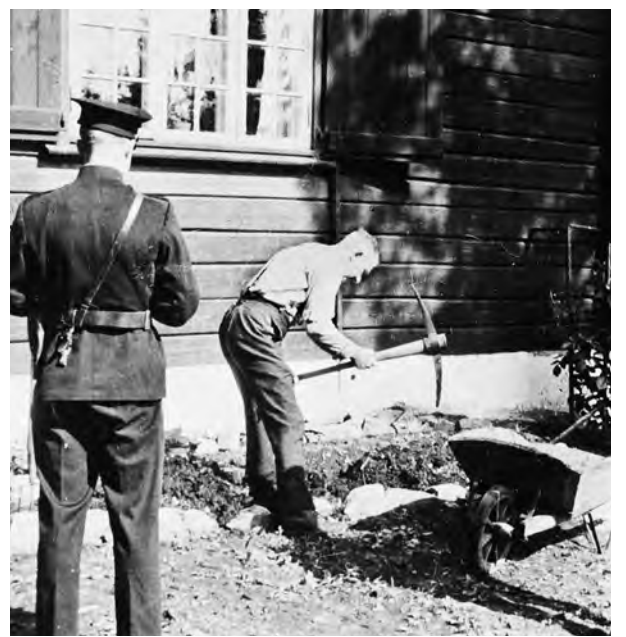
INTERNERT: Biskop Eivind Berggrav ville ikke nevne jødene i bekjennelsesskriftet «Kirkens Grunn». Her er han under vaktthold på sin hytte i Asker, der han var internert i over tre år.