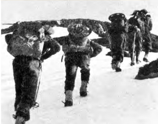
UTE PÅ OPPDRAG: En gruppe fra Kompani Linge ute på oppdrag et sted i Norge vinteren 1942.