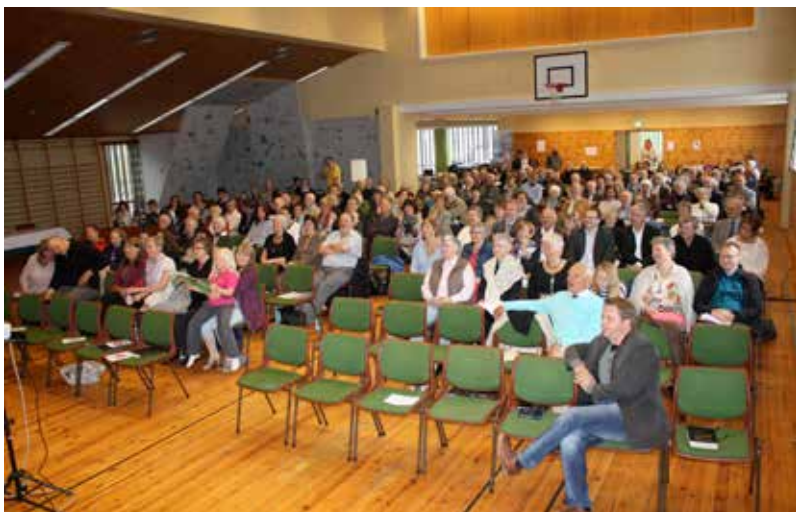
Forsamlingen søndag formiddag