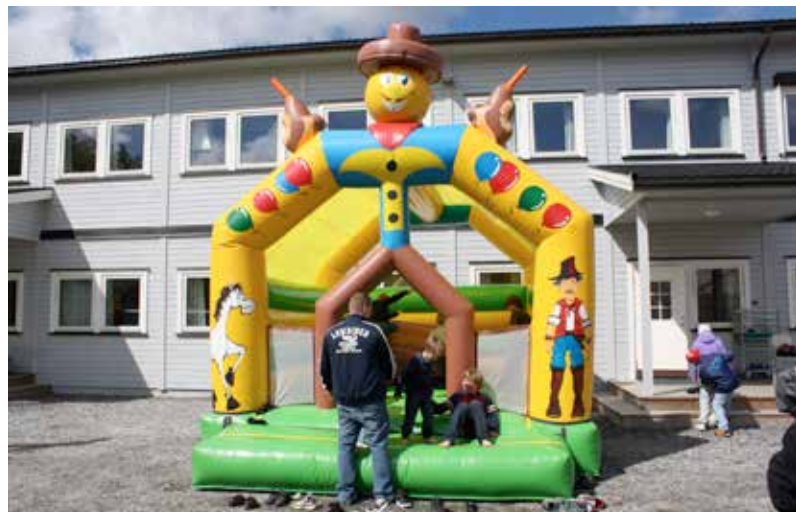
Vi hadde hoppeslott m.m. til barna også dette året

Det er alltid med en viss spenning vi inviterer til NRI sin største og viktigste samling. Vil folk komme, vil folk trives, vil samlingene gi inspirasjon og nytt mot? I år kan vi stort sett svare JA på alle disse tre spørsmålene.