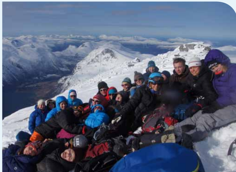
Her er nesten hele klassen samlet på toppen. Til venstre ser vi Eikesdalsvatnet og Øverås.

På Telemark plusslinje på Høgtun lærer elevene tindebestigning på ski.