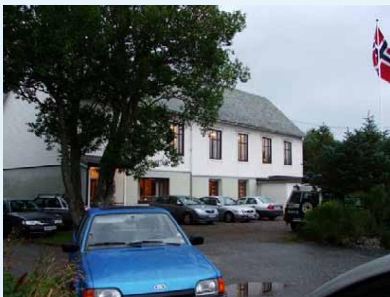
Rød bedehus, Aukra

og oppmuntre kvarandre," vart det m.a. sakt. Ein samanhengande møteaksjon