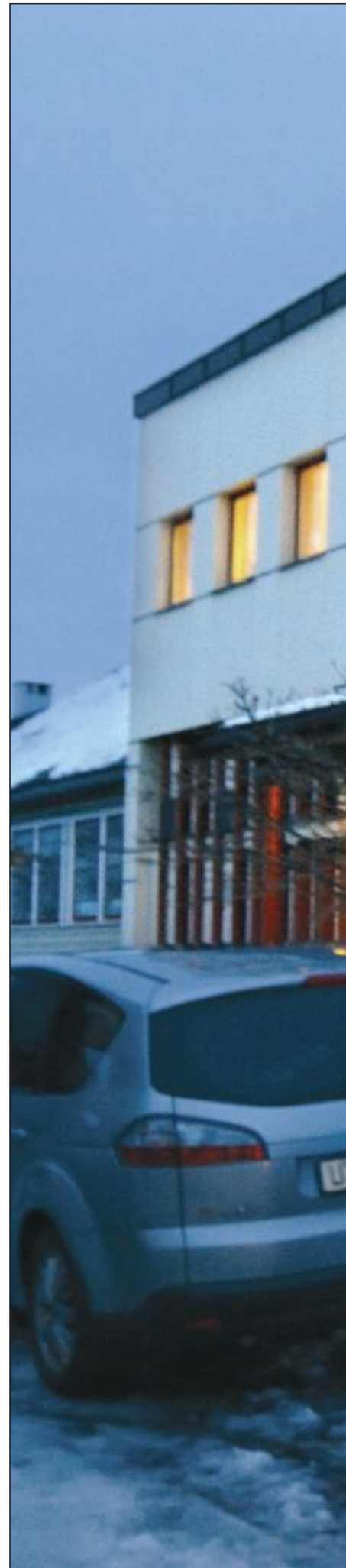
Et av Romsdals eldste – og fortsatt i bruk – til bedehusene blant annet ved å stå som museum.