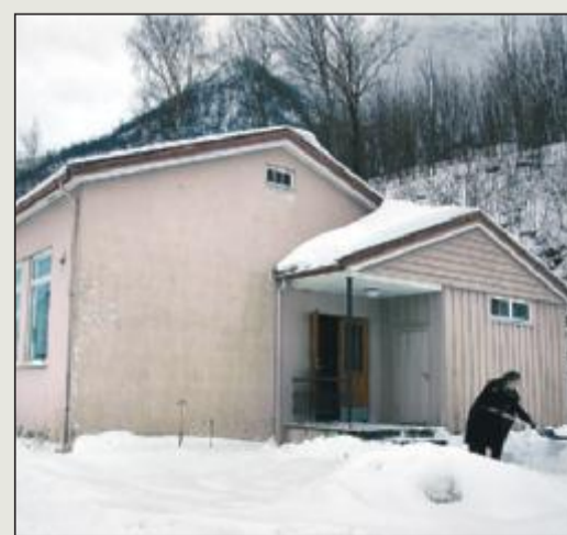
Nedlagt: Bedehuset på Veblungsnes i Rauma.