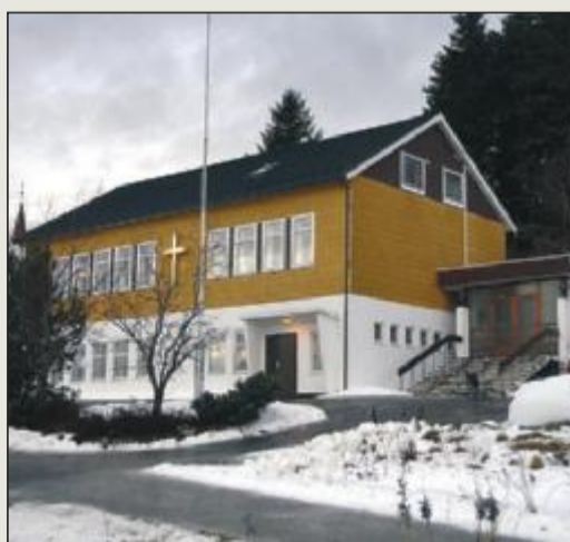
Levende: Bedehuset i Vestnes.