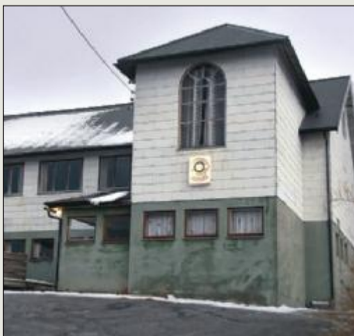
MC-klubb: Tidligere Lid bedehus i Tomrefjord i Vestnes.