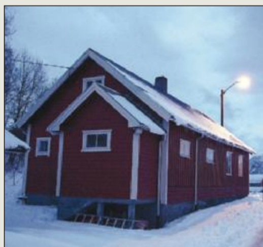
Bolig: Bedehuset i Torvik i Rauma.