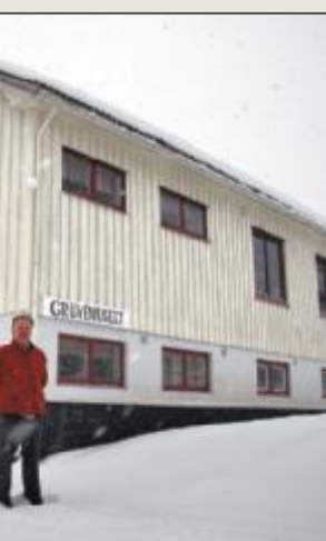
nd bedehus i Nesset.