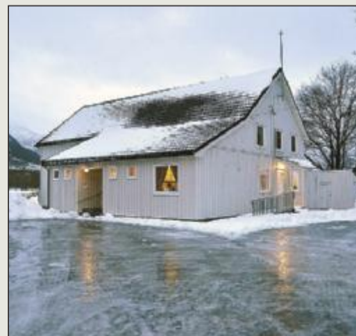
Skolefritidsordning (SFO): Bedehuset i Batnfjorden i Gjemnes.