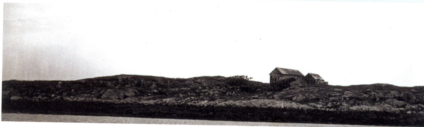
Monsøya sett fra sjøen