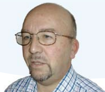
av Jan Inge Nasvik

skapes ikke av ytre ting, men av vår egen holdning. Jeg husker en ungdomssang vi brukte å synge der det står i v. 3: Vis dem deg selv så unge øyne stråler! Gi dem din kraft som bærer og som tåler! Salv dem med Ånd og gi dem seirens gave over det lave. Dette gjelder både for ung og for gammel. - Den kraften som bønner og takken gir, den tåler alt. Den skaper glede som varer! La oss begynne med å be og takke, selv om vi kanskje ikke synes vi har noe å takke for. Vi må be Herren gi oss mer takknemlighet, - og evne til å se Guds gaver og oppgaver han daglig vil gi oss.