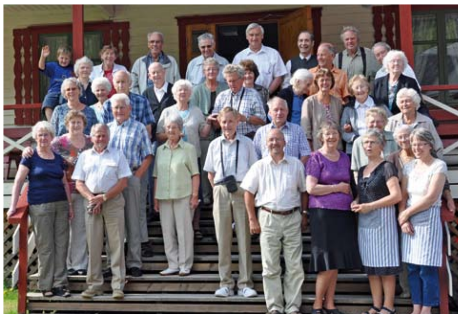
En flott gjeng samlet på trappen

Feriedagene ble avsluttet med formiddagsmøte og middag på søndag. Det var samstemmighet om at det hadde vært noen rike og fine feriedager. Alle ønsket å komme tilbake neste år om Gud vil, og vi må få enda flere til å komme.