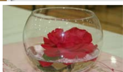
Noen av dekorasjonene som pyntekomiteen hadde laget til

Pyntekomiten hadde gjort en fantastisk jobb og pyntet hele det store Træffhuset på en flott måte med et lite budsjett. Svært mange la merke til de flotte dekorasjonene rundt om. Noen ville også kjøpe bordbrikkene i matsalen, og vi har faktisk noen igjen hvis det er flere som vil ha en souvenir fra GF.