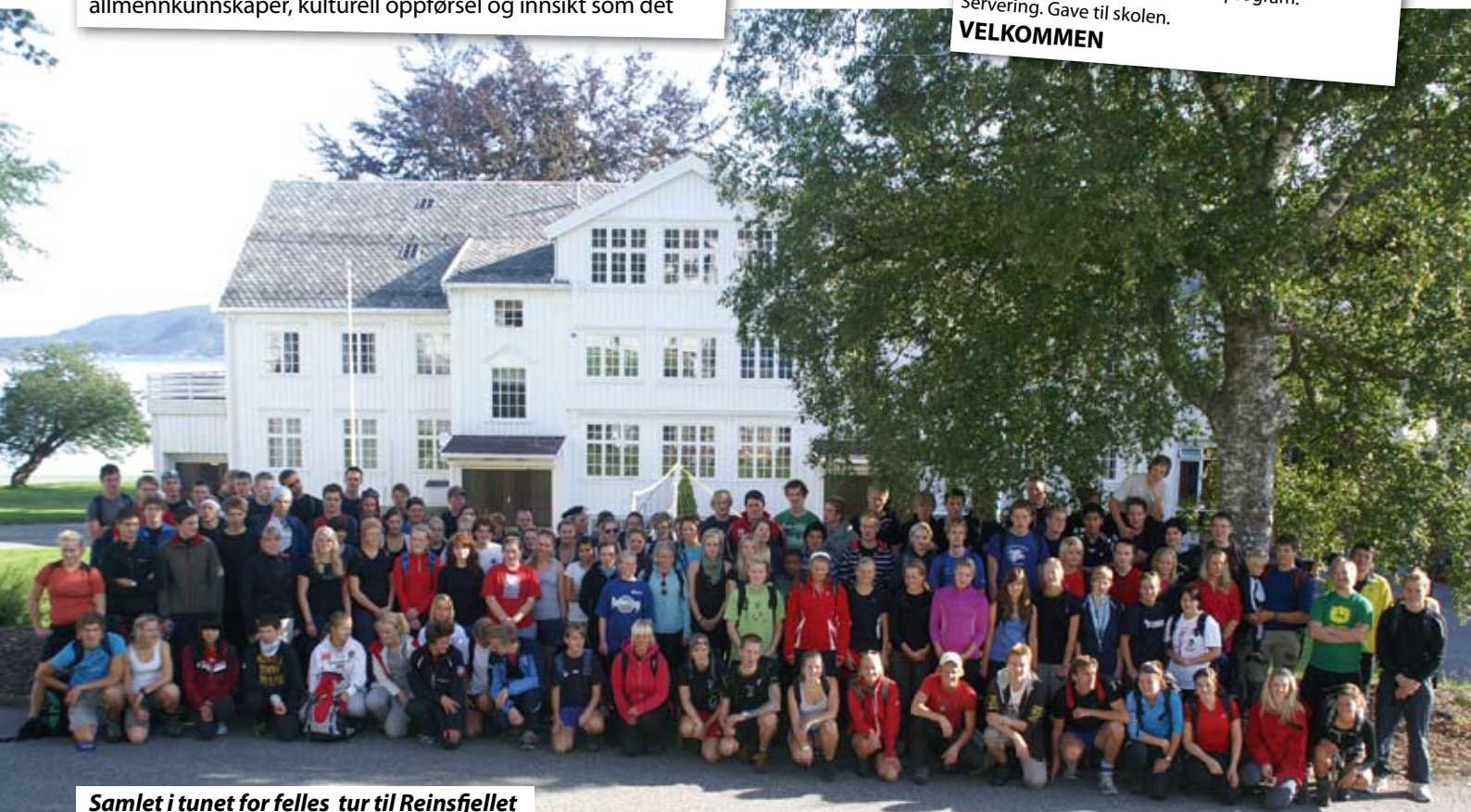
Samlet i tunet for felles tur til Reinsfjellet