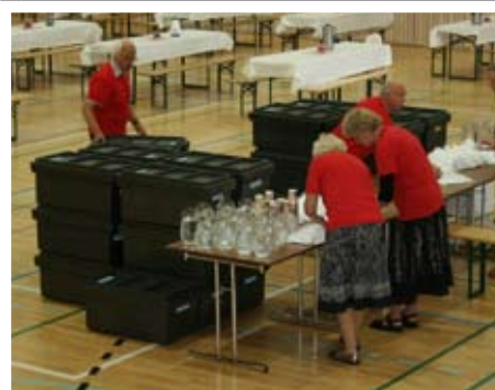
Alle ble mette under GF. Her noen glimt.

Det var mange munnar som skulle ha mat disse dagene og med unntak av barneopplegget var det her det var bruk for mest dugnadsfolk. Rundt 400 skulle ha mat på de største måltidene. Her kom maten levert fra catering, og med unntak av et lite feilskjær gikk dette veldig greit. Maten var god og alle ble mette.