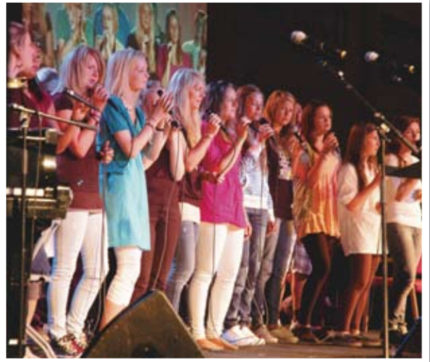
Konsert under GUFF

Generalforsamling for Ungdomm (GUFF) hadde sin base i gymsalen på Sellanrå skole. I tillegg brukte de den store klatreveggen i Træffhuset en god del. De var ikke så mange, men hadde gode samlinger om Guds ord. Fredag var GUFF på tur til Rangøya på Averøya hvor sjøsport sto på programmet.