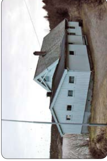
Lesundet bedehus Aure