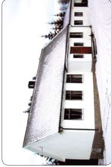
Skarsgrenda bedehus Aure