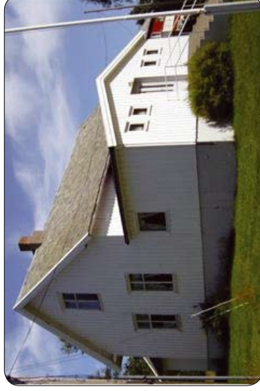
Leira bedehus Tustna