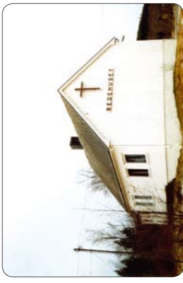
Kjorsvikbugen bedehus Aure