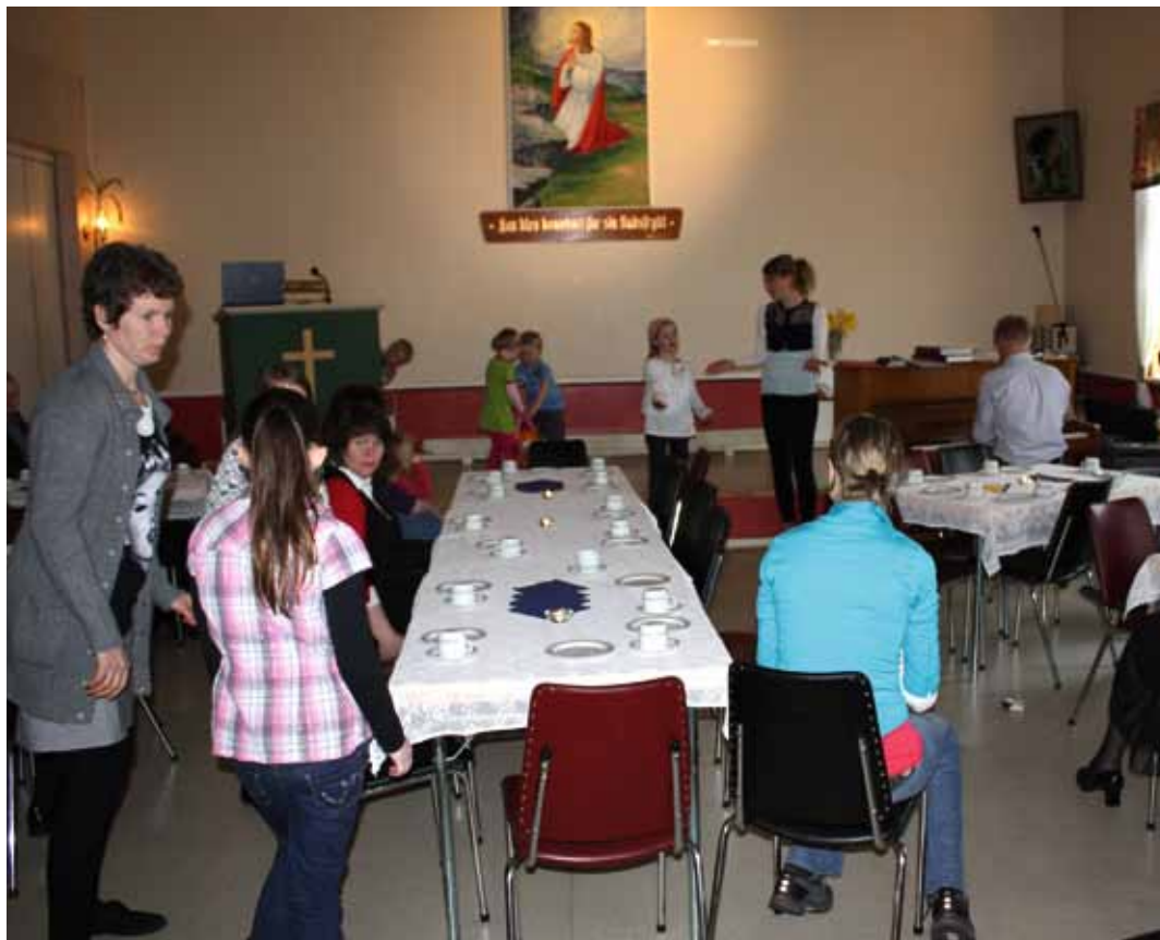
STORSAMLING: Storsamling i Midsund Indremisjon.

Jeg tror vi må se på det i flere bygder og oppmuntre til samarbeid bygdene i mellom. En får da se at en er ikke så få som en tror. Vi savner de unge mange plasser, og vi ber og håper på vekkelse. Men det er Herren som må sende vekkelse. Det kan hende at Herren ser at vi som kristne ikke er klar til å ta i mot en vekkelse i blant oss.