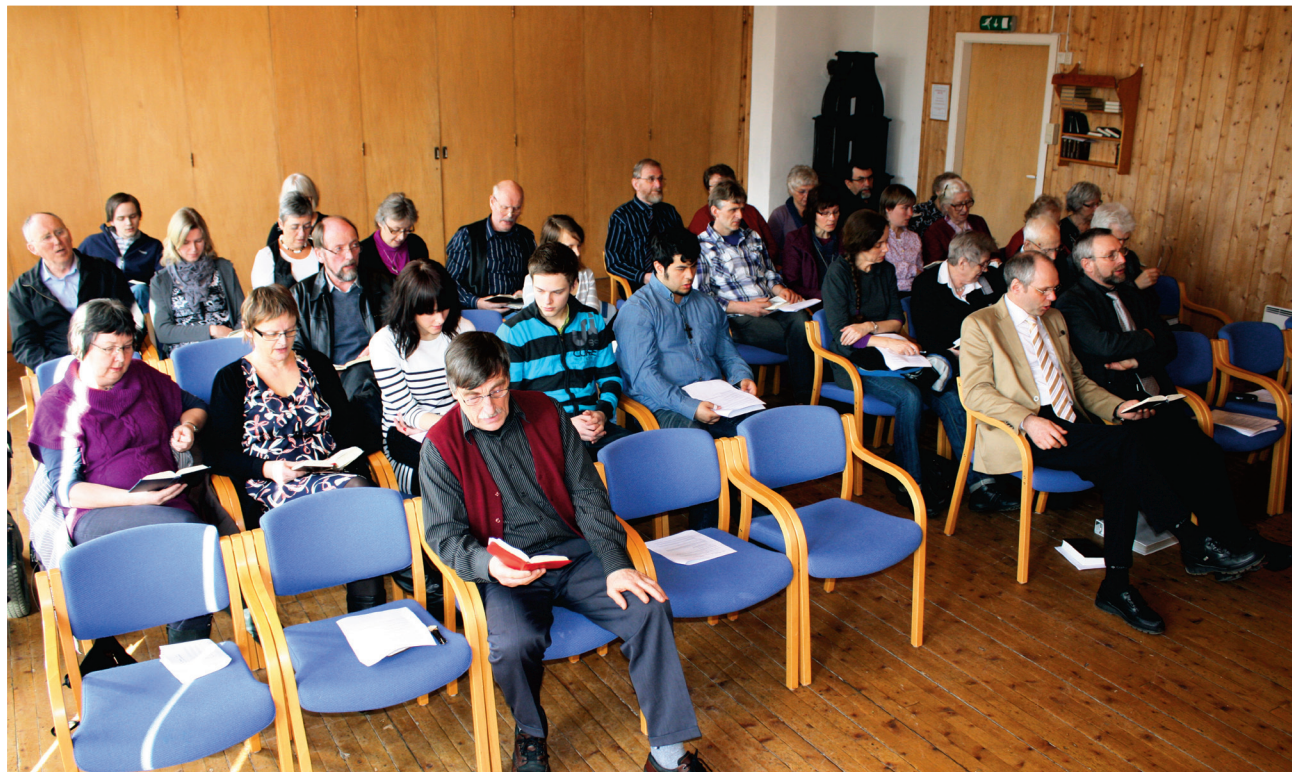
Avslutningsmøte under påskemøtet i Aure.

For han gjemmer meg i sin hytte på den onde dag, han skjuler meg i sitt skjer- mende telt. På en klippe fører han meg opp. Salme 27:5