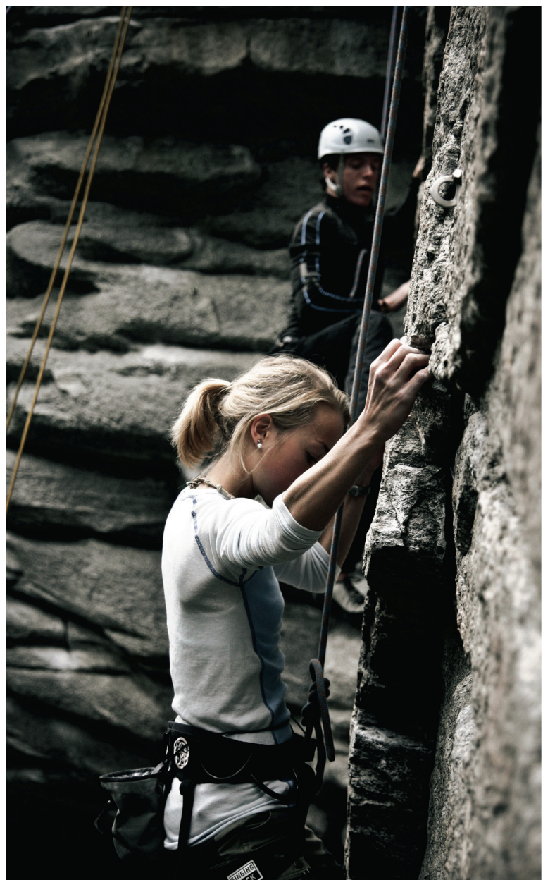
Skolen har mye klatring på sine friluftslinjer, i tillegg en egen pluss linje som har klatring to dager i uken. Det er stor søknad på klatring også for neste skoleår.