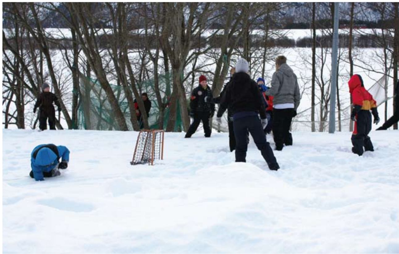
MYE SNØ: Det var ikke vanskelig å lage vinterleker med årets snømengder.