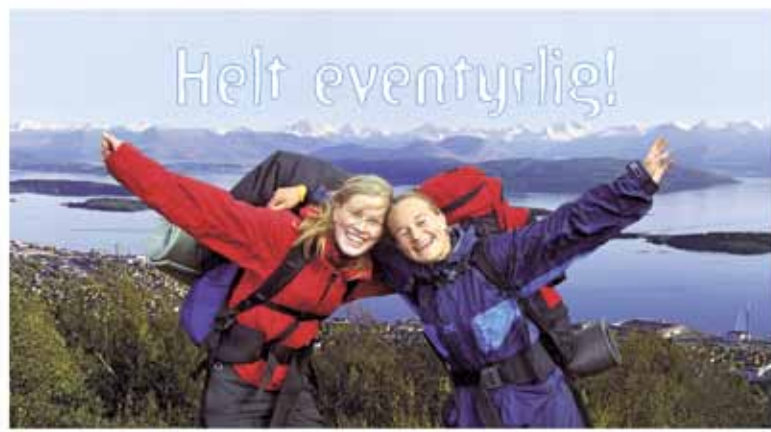
Vi tilbyr et skoleår med utfordringer, opplevelser, kunnskap, fellesskap og vennskap. Skolen ligger vakker til med nærhet til sjø og fjell.

Vær med i forbønn for elever og personale ved skolen. Be om at Gud må velsigne elever og personale ved skolen. Be om at vi som personale kan være gode forbilder og vitner for Jesus i møte med våre elever. Be om at vi