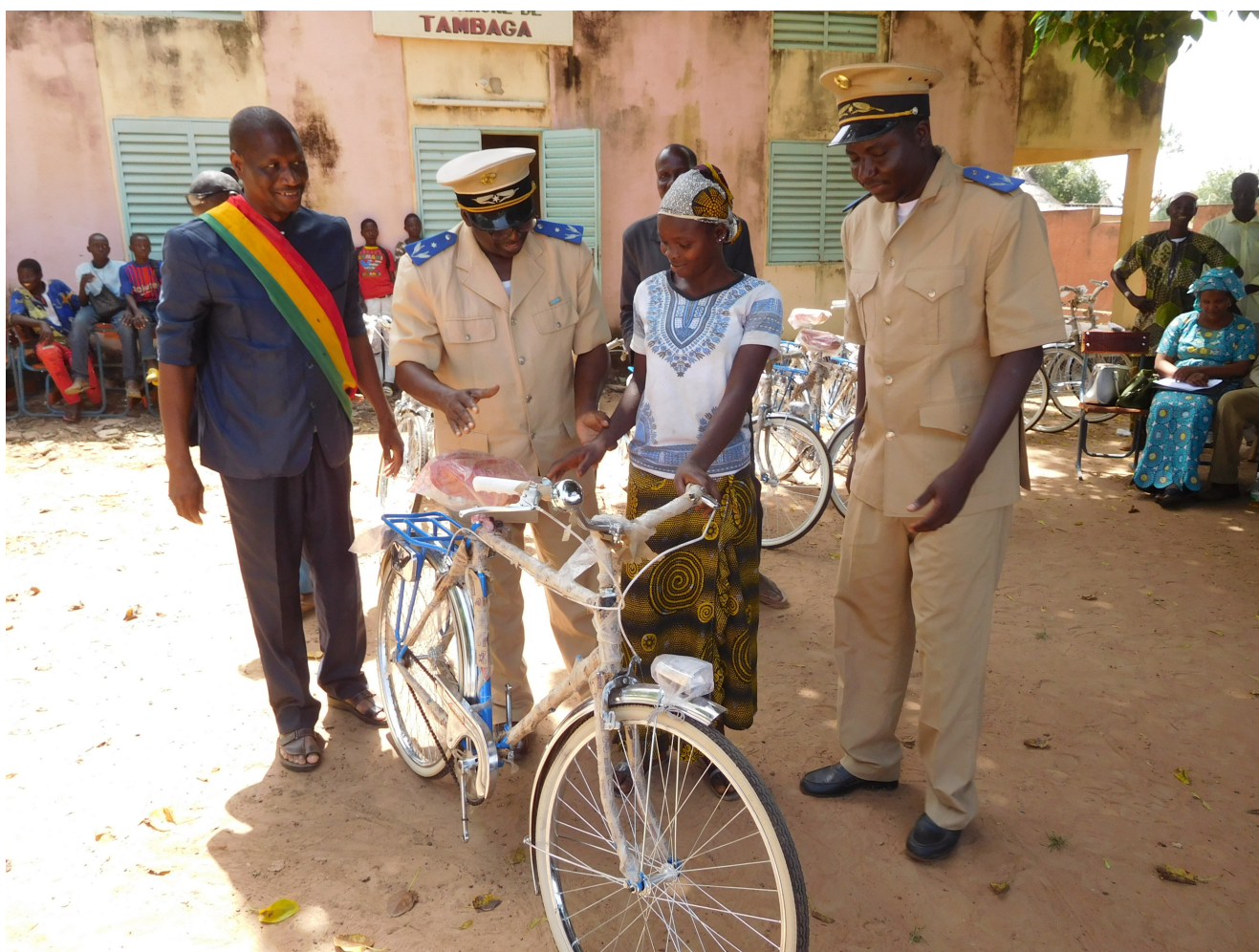
Ordførar i Tambaga kommune saman med fylkesmannen i Kita under utdeling av sykklar i okt. 2018 ved Tambaga ungdomskule. Myndighetene støttar prosjektet og meiner det hjelper fleire til skulegang!

PS! Då prosjektet byrja ved Katab ungdomskule i 2014, var andelen jenter litt over 20%.