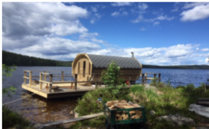
Bilden visar en 390 bastu och en 8 meter flotte