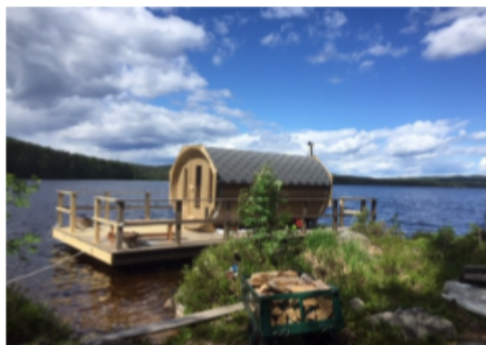
Bilden visar en 390 bastu och 8 meter flotte