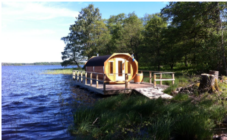
Bilden visar en 450 bastu och en 8 meter flotte