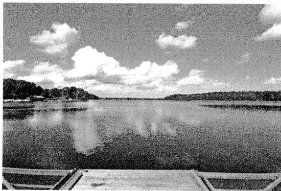
Utsikt över Bagghusfjärden från båthamnen

OBS Stämmohandlingar utdelas vid Triple Boule Cup 2012 den 17 maj och för de som inte deltar vid utdelningen av handlingar kommer handlingarna via posten. Inbetalningsblankett ingår i handlingarna endast för de som har frånvaroavgift övriga skall betala in båtplatsavgifter och föreningsavgiften på pg 736059-7 enligt debiteringslängden senast 31 juli.