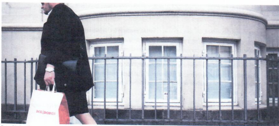
Det er ikke lige til at se, at der i kælderens her på Alhambravej på Frederiksberg ligger en virksomhed med aktiver for 42 milliarder.

Han er næsten alene om at tjene ni mia. kr. En advokat på Frederiksberg bestyrer en omfattende gruppe af udenlandske koncerners holdingselskaber - en forretning, der ifølge ham selv er ved at forsvinde.