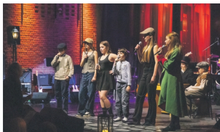
SANG: Sanggruppa sang med glede og engasjement under forestillingen lørdag.