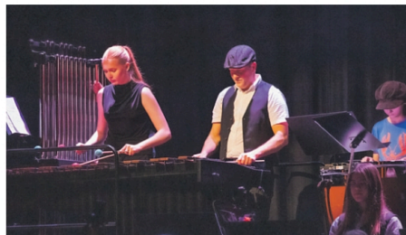
ABBA MED VRI: Forestillingen inneholdt innslag av xylofoner som blant annet ga en flott vri på Abbas "Money Money Money".