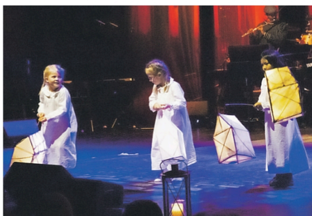
DE YNGSTE: Knøttedans hadde også et søtt og herlig innslag

Lessalg: Lunde: Kiwi, Coop Extra Ulefoss: Coop Extra, Spar, Kiwi, Esso, Ringstad Kiosk Best Ulefoss Bø: Meny