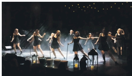
FLOTT DANS: Publikum kunne glede seg over flotte danseinnslag.