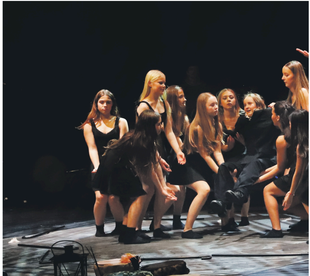
FLOTTE PRESTASJONER: Nome kulturskole hadde flust av gode innslag under årets juleforestilling. Her med kulturskolens dansere som tar bilder og video fra forestillingen.