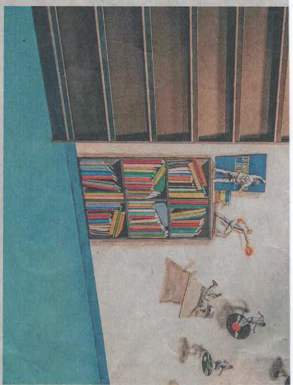
... of zinspelen op een vlucht uit de werkelijkheid.