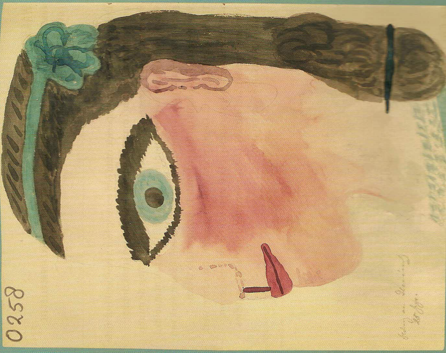
Heideug von Stehrits - Privé-collectie, Heidelberg