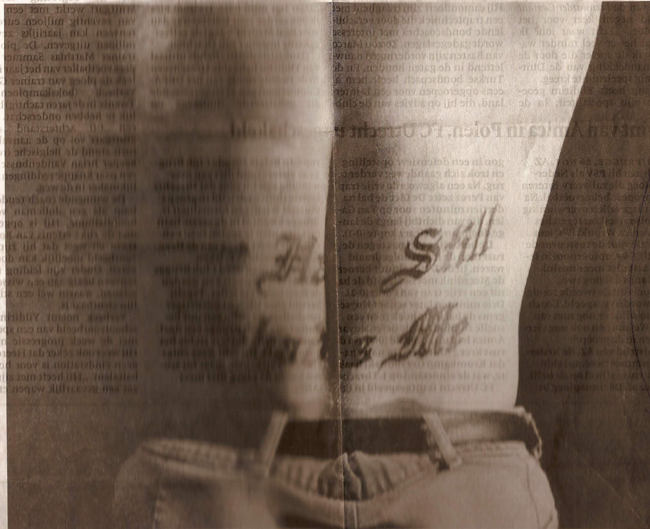
De rug van een van de gevangenen in de Zweeds documentaire 'Rehearsals'

Leszczylowski had een film over Tarkovski gemaakt en liep al rond met het plan voor een film over Norén. Hoe de repetities – spraakverwarrende vertoningen waarin tekst en protest daartegen naadloos in elkaar overliefen – zouden uitpakken, kon echter hij noch Norén voorzien. Twee van de drie gevangenen bleken overtuigde neo-nazi's; hun antisemitische theorieën werden door Norén in het stuk