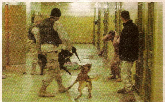
2003: In de Abu Ghraib-gevangenis worden gevangenen mishandeld