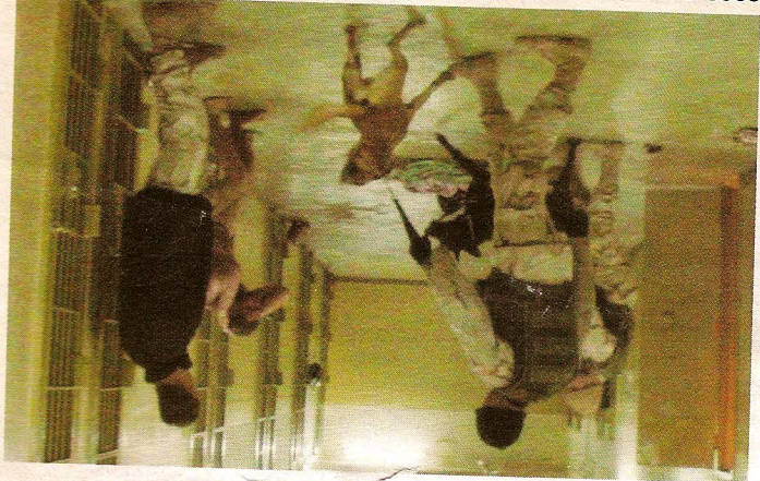
2003: In de Abu Ghraib-gevangenis worden gevangenen mishandeld

lyke studie ten behoeve van een artikel in een tijdschrift. Zimbardo bewees dat doodgewone, gezonde mensen onder verkeerde omstandigheden kunnen veranderen in beulen die hun gangen net zolang psychisch martelen tot ze breken. 'Van ieder fatsoenlijk mens valt een duivel te maken,' stelt hij onomwonden. 'Want niet de aard van de mens is bepalend of hij zich goed of slecht gedraagt, maar de situatie waarin hij zich bevindt.'