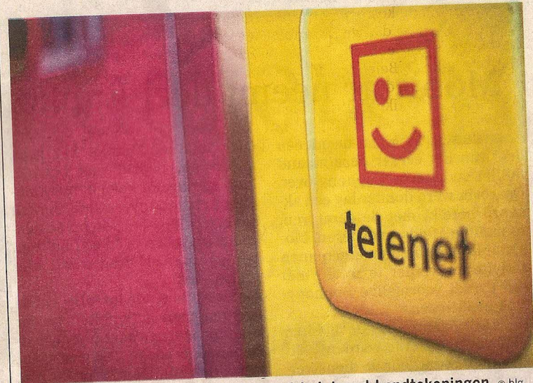
Telenet is niet onder de indruk van drieduizend handtekeningen.