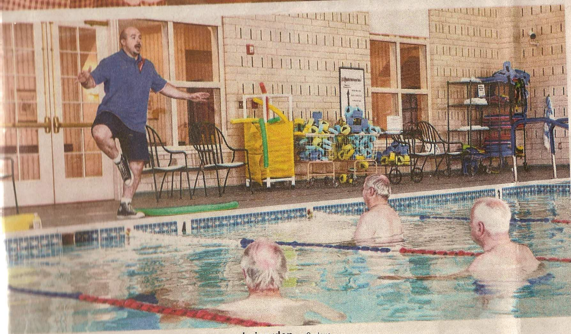
biologische schoonmaak en wellness voor bejaarden.