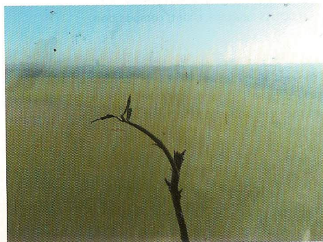
Photographie extraite d'un atelier mené par le GSARA au sein de l'Établissement de défense sociale de Paifve, 2010

Regards croisés sur l'établissement de Défense sociale de Paifve