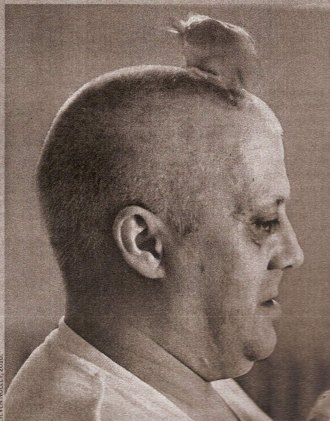
LIEVEN NOLLET, 2010

► Le photographe Lieven Nollet donne à voir l'enfermement psychologique.