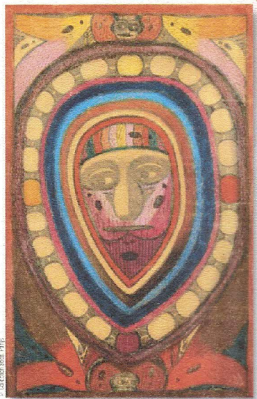
▲ Adolf Wölfli, 'Christoph Columbus', 1930.