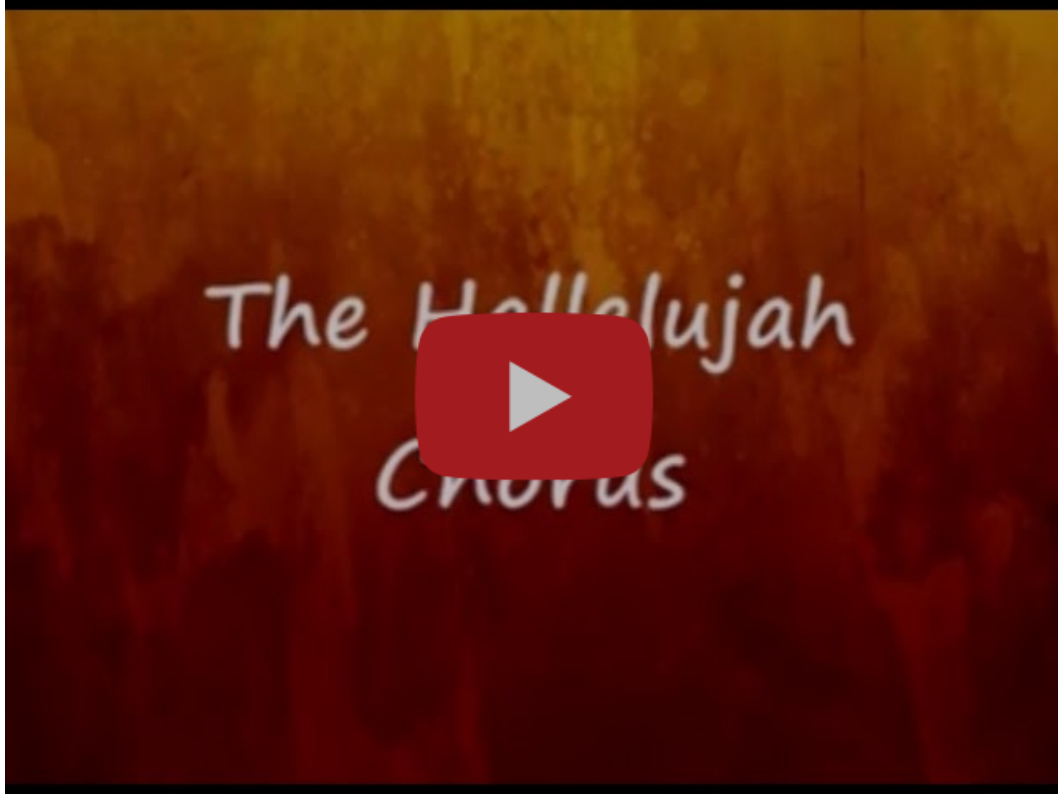
Messiah, HWV 56: No. 44. Chorus: Hallelujah - The Mormon Tabernacle Choir