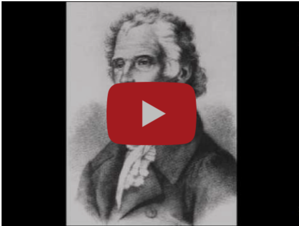
Dimitri Borniansky (1751-1825) - Tebe poem Varosminor Chamber Choir Boedapest 2008

Tekst: Orthodoxe Liturgie van de heilige Johannes Chrysostomus