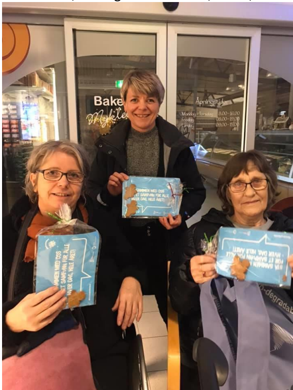
3. des 2019 i Ballangen/Narvik

3. desember ble markert i Tana, Hammerfest, Tromsø, Ballangen og Narvik. Vi hadde både foredrag, teammøter, testing av klatreruter, stand, kaffe og pepperkaker.