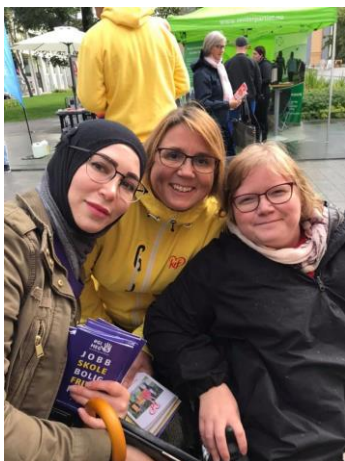
KrF i Tromsø

Under frivillighetsdagen 2. september hadde NHF Nord-Norge, sammen med NHF Tromsø, NHFU, LFN og LKB og FFO standplass. Vi fikk besøk av flere politikere, men stand i seg selv er ikke den mest effektive måten å nå ut med budskapet vårt. I løpet av denne dagen valgte vi å kjøre «hvis jeg var deg, og du var meg-metode» på politikere og vi spurte de om hvordan de trodde at deres liv ville vært dersom de måtte bruke rullestol. Vårt inntrykk er at mange fikk en aha-opplevelse i forhold til hvordan det ville være å komme seg inn på arbeidsplassen, hvordan det ville bli å følge opp barna på trening med mere. Da benyttet vi anledningen til å gjøre de oppmerksom på at disse forholdene kunne de gjøre noe med som politikere ved å satse på uu og gode BPA-ordninger. Vi hadde også valgkampstunts i Narvik, Tana, Lofoten og Hammerfest. Der sto våre folk på stand.