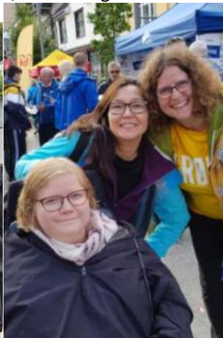
MDG i Tromsø