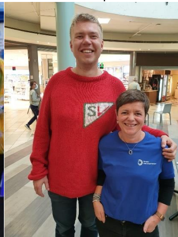
SV i Narvik

Høsten 2019 hadde vi også to sentrale samarbeidsprosjekt med andre, SOS Barnebyer St. Petersburg og Finnstjerna Bokollektiv i Vadsø. Hensikten med det russiske samarbeidet var å lære mer om hvordan funksjonshemmede har det i Russland, og hvordan vi kan inspirere hverandre for å løfte funksjonshemmedes menneskerettigheter over landegrensene. Vi fikk besøk av en delegasjon på 7 russiske damer, og vi hadde noen lærerike dager hvor vi besøkte skole, barnehage, Statped og