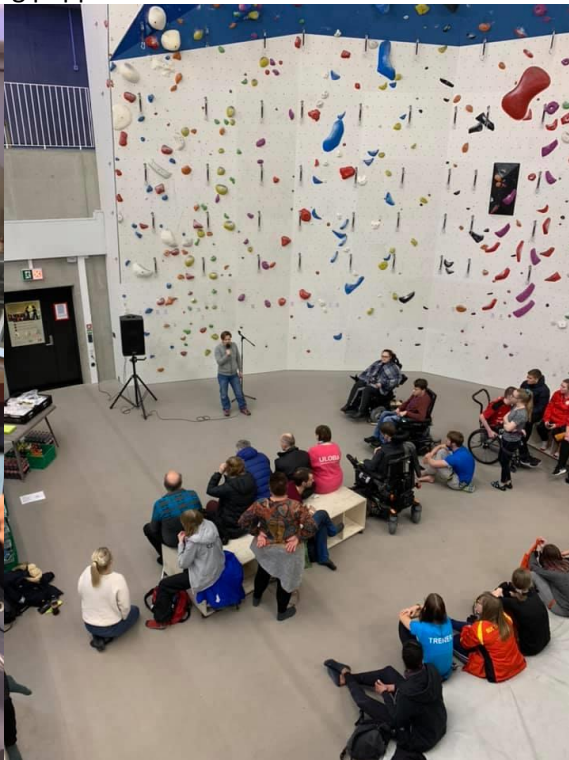
3. des 2019 i Tromsø