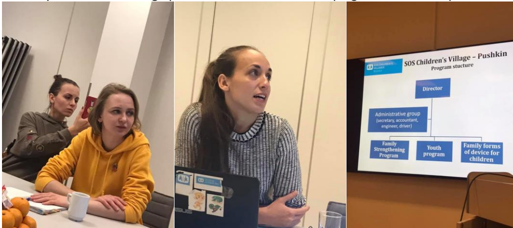
Besøk av SOS Barnebyer St. Petersburg høst 2019.

frivillige organisasjoner. Videreføring av dette prosjektet var at NHF Nord-Norge skulle besøke SOS Barnebyer i St. Petersburg april 2020, men dette falt ut på grunn av koronapandemien.