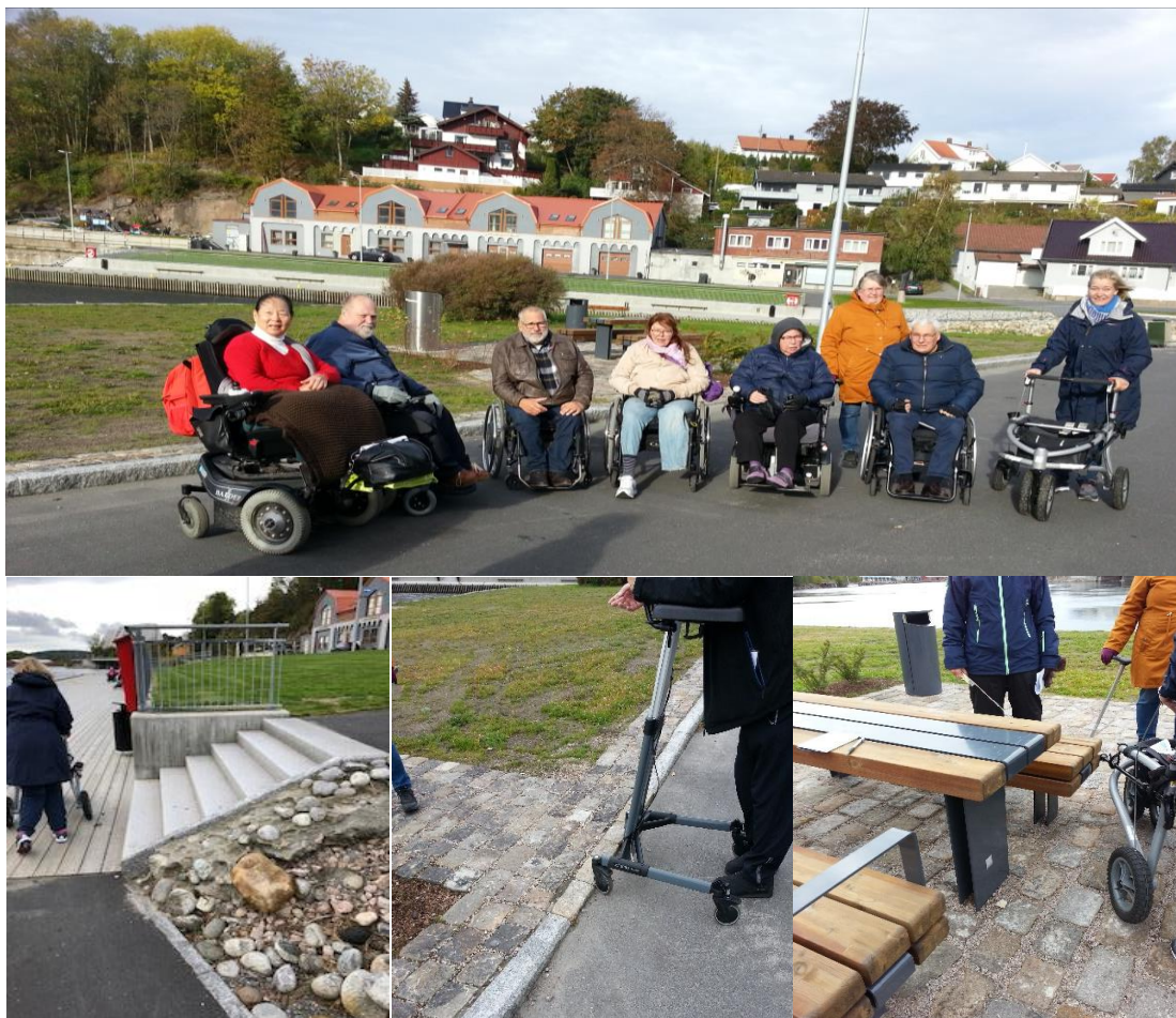
Teori omsatt til praksis på PBL-kurset med befaring på Pæddekummen i Sarpsborg

Kurs/studieaktiviteten har blitt finansiert med tilskudd fra Helse Sør Øst, Akershus fylkeskommune, Østfold fylkeskommune, AOF Østfold, Extrastiftelsen og egenandeler.