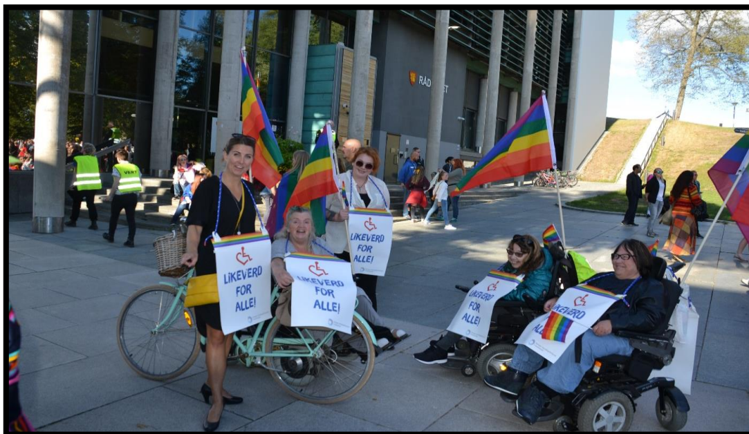
NHF Fredrikstad er en del av det lokale samarbeidet Likeverdalliansen. Her under Pride i 2018.

NHF Øst skal ikke ta æren for Likeverdalliansen i Fredrikstad, men vi er stolte «andelseiere» i dette spesielle samarbeidet. Likeverdalliansen er et uformelt samarbeid som jobber saksrettet i Fredrikstad kommune. Alliansen står sammen for å påvirke politiske saker og for å få medieoppmerksomhet rundt «våre» saker. Alliansen består av HBF Østfold, FFO, NHFU Østfold, Ryggmargs- og hydracepalusforeningen, Uloba og NHF Fredrikstad. Likeverdalliansen har verken et styre eller formelle møter, men klarer likevel å mobilisere stort og få mye oppmerksomhet når de trenger det. Deres største seier er i BPA-saken.