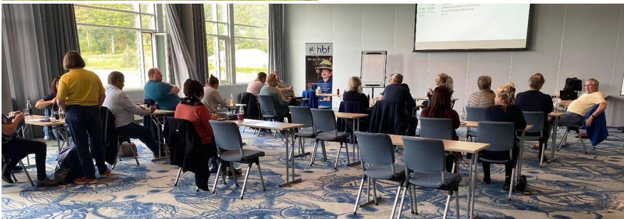
Foreldrehelg i regi av HBF Østfold

Arrangementet ble veldig vellykket, det ble en flott dag ute med både kjente og ukjente, og en liten dose fysisk aktivitet.