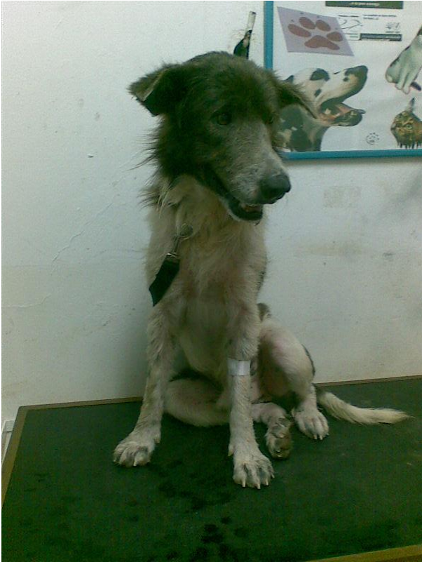
(MuhKuh als wir ihn