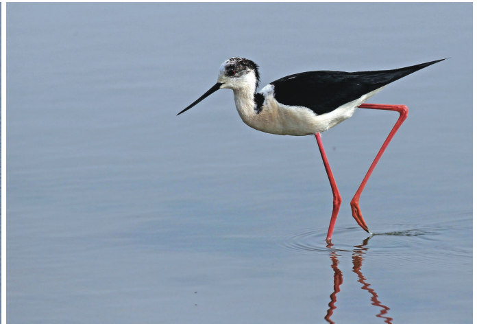
Groenpootruiter & steltkluut