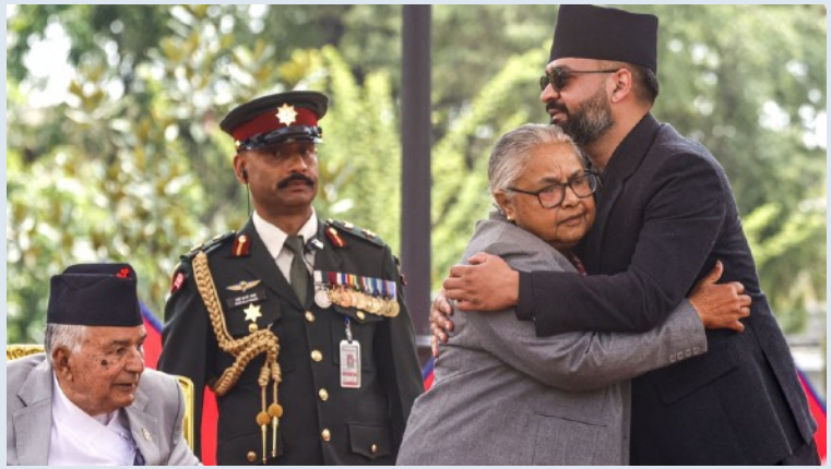
Segraren Balen kramar om interimspresidenten Sushila Karki.

Men nepaleser utomlands representerar troligen ett röstblock för förnyelse, och de har