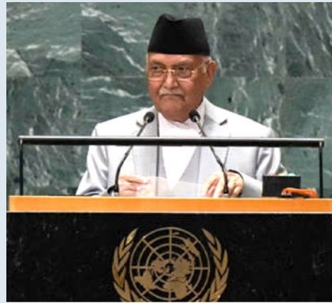
KP Sharma Oli i FN år 2024.

Minst 77 personer dödades i samband med protester mot korruption i landet i september, som inleddes på grund av ett kortvarigt förbud mot sociala medier men som utlöste