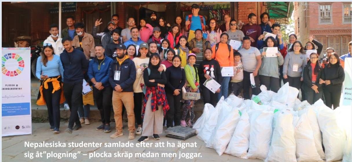
Nepalesiska studenter samlade efter att ha ägnat sig åt ”plogning” – plocka skräp medan men joggar.

Sverige Alumni Network Nepal (SANN) är ett alumninätverk för nepalesiska studenter som har studerat i Sverige, fått ett stipendium från Svenska Institutet eller deltagit i Svenska institutets ledarskapsprogram.