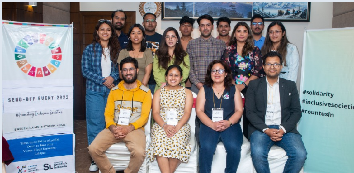
Send off-event inför avresan till Sverige.

SANN bildades 2022 med 25 medlemmar som nu har vuxit till ett nätverk med 56 medlemmar. Sedan 2022 har SANN i samarbete med Svenska Institutet och andra partnerorganisationer hittills anordnat eller deltagit i mer än 24 evenemang. Några exempel på våra samarbeten är Gender Debates, Send-Off events, Plogging, Waste management workshops, Fika-sammankomster, deltagande i utbildningsmässor, Orientation on Study in Sweden, Filmvisningar, plantageprogram, paneldiskussioner, kapacitetshöjande evenemang och så vidare.