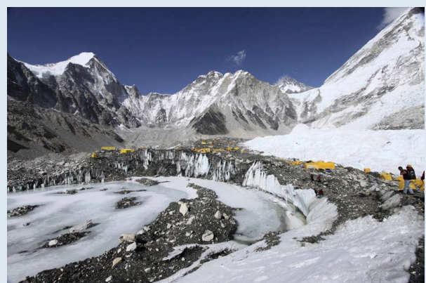
Isen på en glaciär i närheten av Mount Everests topp smälter i snabb takt. På fotot syns baslägret i Nepal.

Om smältprocessen fortsätter i samma hastighet kommer South col "sannolikt att försvinna inom några få decennier", säger Paul