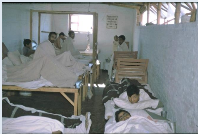
Första avdelningen öppnad!