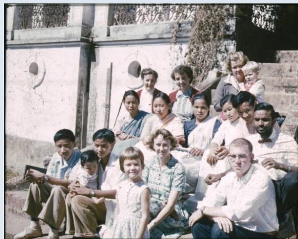
Kolonin har vuxit.

En strid ström av Tansenbor fyllde husets alla delar dagligen. Så småningom växte en längtan fram hos flera av de aktiva