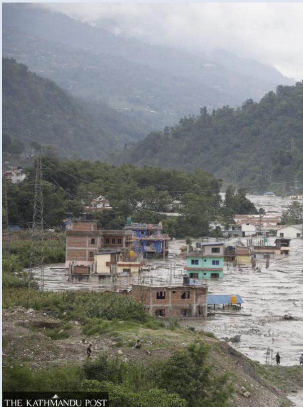
Översvämning i Melamchiområdet

Den 14 juli drabbades Melamchi av en översvämning förorsakat av ett jordskred som ledde till att en damm brast och enorma mängder vattenmassor sköljde över byarna utefter flodstränderna.