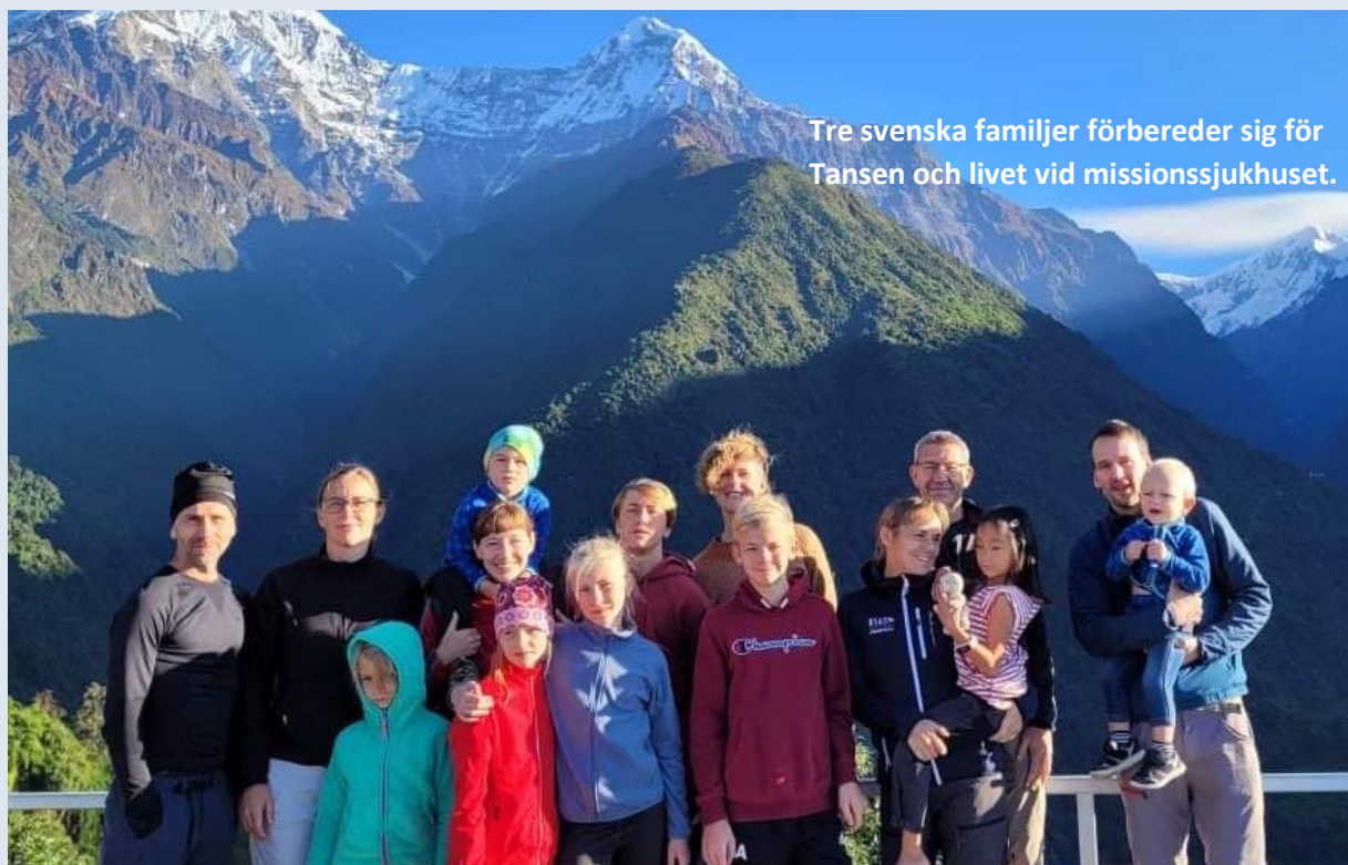
Tre svenska familjer förbereder sig för Tansen och livet vid missionssjukhuset.