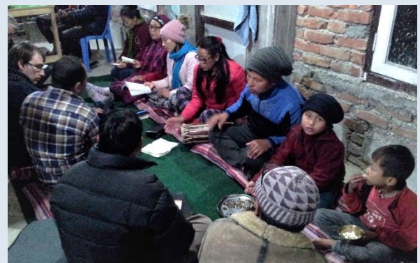
Denna husförsamling träffas varje torsdag, året om och har gjort så i många år.

Bland det starkaste i boken är att läsa Appendixet, de femton sidorna i slutet, med 85 olika fall beskrivna, alla med uppgifter om tidpunkt, vilken domstol, hur många och vilka som dömts. Längden av straffen varierar, dagar, månader, eller flera år. Många misshandlas brutalt.