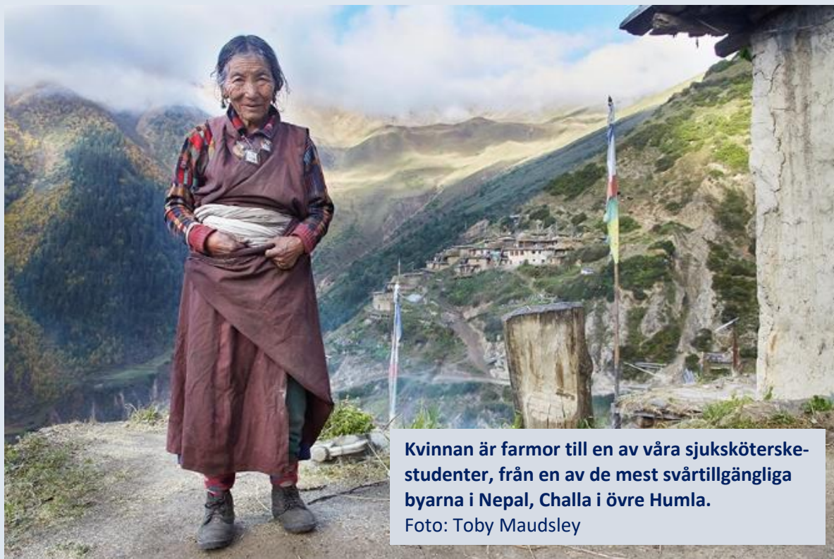
Kvinnan är farmor till en av våra sjuksköterskestudenter, från en av de mest svårtillgängliga byarna i Nepal, Challa i övre Humla.