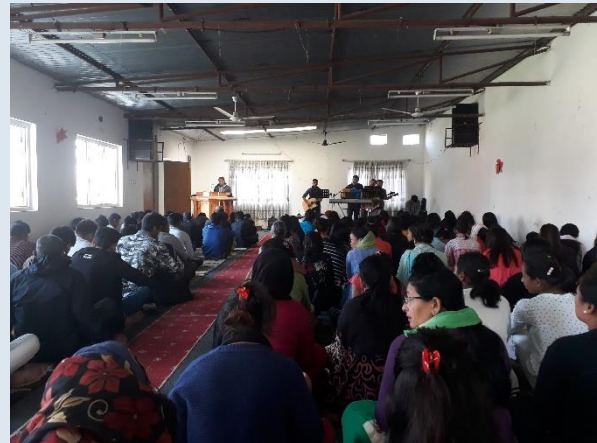
Gudstjänst i Patan 2018

Det gör att landet inte är så drabbat av utländska väckelsepredikanter som dyker ner i landet och har kampanjer, utan de kristna får fungera i lugn och ro. De fortsätter att dela sin tro och husförsamlingarna förökar sig.