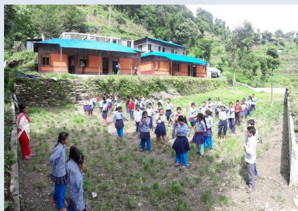
Den nybyggda skolan som byggdes med hjälp av earth bricks från Build Up Nepal.

Utbildning är en central del av vår verksamhet. Både skolgång och högre yrkesutbildningar. Vi har hittills finansierat utbildning för 19 unga kvinnor till sjuksköterska på kandidatnivå, Health Assistant, Skilled Birth Attendant eller farmaceut. De flesta av dem arbetar på Health Posts i sina hemdistrikt eller i nationella projekt kring reproduktiv hälsa.