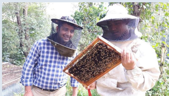
Biodlingsprojekt i byn Majhigaun i Nuwakot.