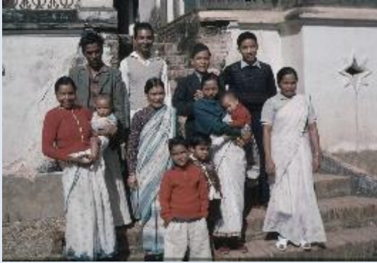
De första kristna, dagen de fängslas. Foto: Ragnar Elfgaard, Tansen 1960

kunde hjälpa. Detta ledde sen fram till en inbjudan att komma och öppna det som idag är Tansens Missionssjukhus.