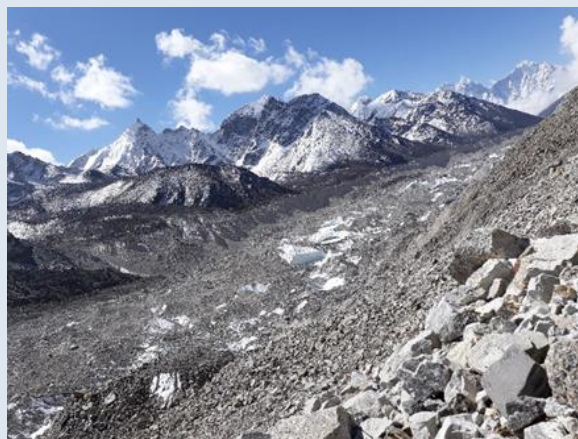
Glaciär vid Everestleden 2018.

Han berättar vidare att glaciär-ras är ingen ovanlig företeelse. Risken är som störst när glaciärens underlag är brant och isen tunn