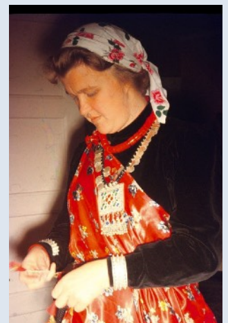
Carna i Magardräkt 1958