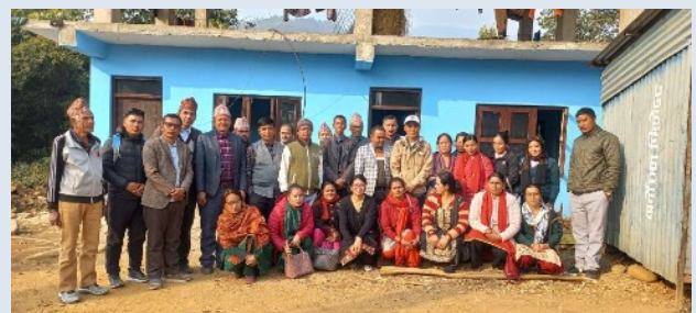
Den obligatoriska gruppbilden efter avslutad uppföljningsträff.