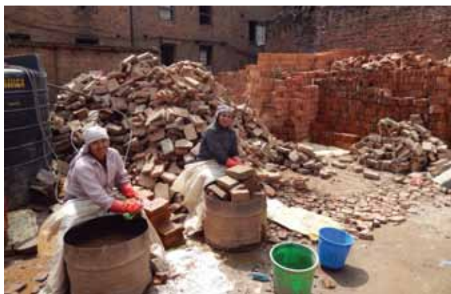
Gamle og nye mursten bliver blandede i hans bygninger, for at de skal se gamle ud