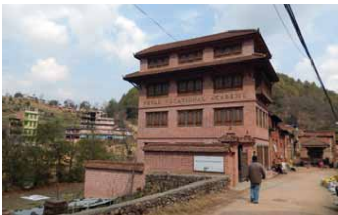
Den nybyggede erhvervsskole i Panauti