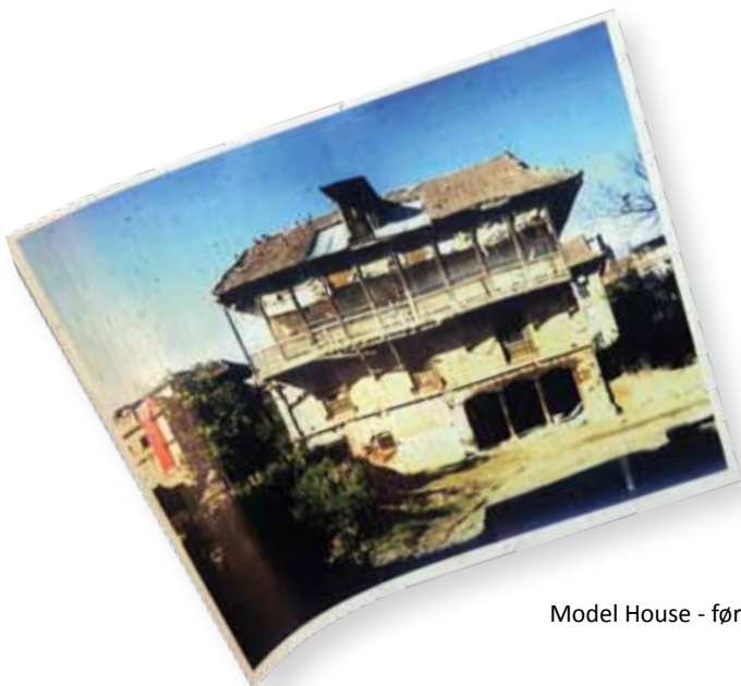
Model House - før og nu.