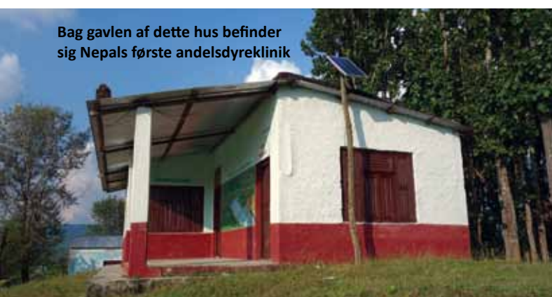
Bag gavlen af dette hus befinder sig Nepals første andelsdyreklinik