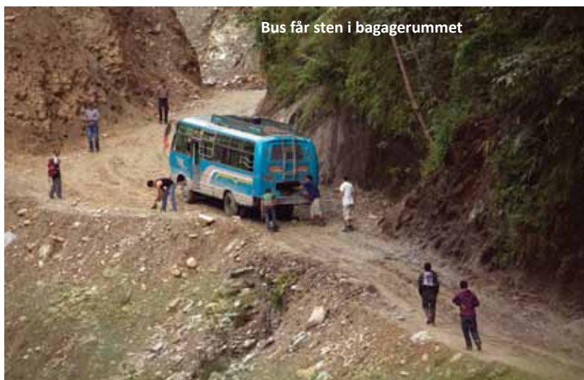
Bus får sten i bagagerummet

Lo Manthang er en fantastisk by at komme til. Stadig om-