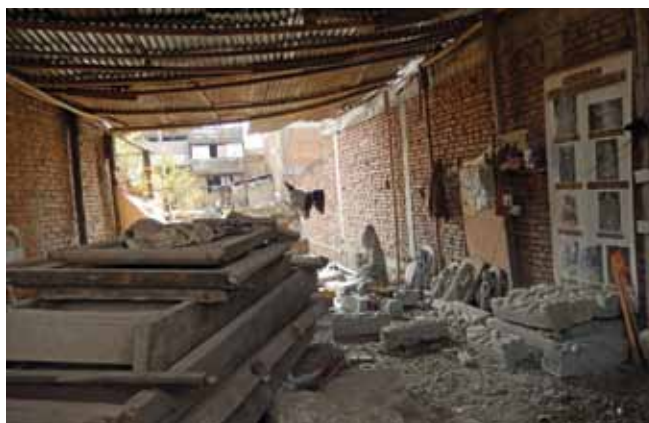
Museum of Stolen Art værksted