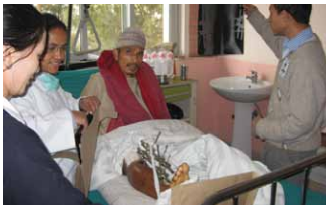
Patienten er med, når det vurderes, om bruddet er undervejs til en god heling.

Stort set alle i Dhulikhel Hospitals ledelse og faste stab er nepalesere, men der er samtidig et udbygget samarbejde med hospitaler og universiteter i USA, Asien, Israel og Europa.