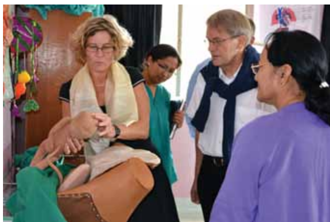
En delegation fra Juliane Marie Centret på Rigshospitalet og Jordemoderforeningen var på besøg i oktober 2013.

Alle aktiviteter foregår på grundlag af klare aftaler med Dhulikhel Hospital og har derfor altid udgangspunkt i et konkret behov. På nuværende tidspunkt er der etableret partnerskaber og samarbejde om bl.a. it og digitalisering, mor/barn-sundhed, etablering af en jordemoderuddannelse, ledelsesudvikling, bæredygtighedsstrategi og donation af uniformer.