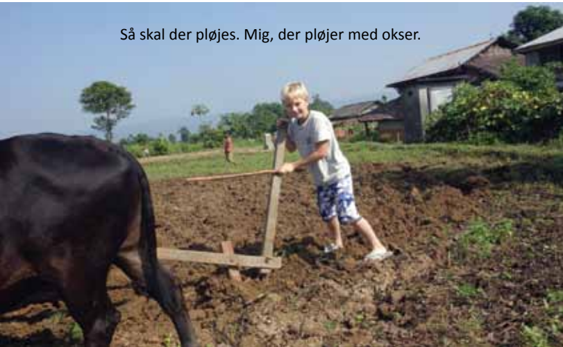
Så skal der pløjes. Mig, der pløjer med okser.