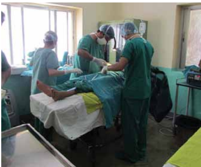
Der udføres operationer på outreach centrene. Et motto er: Vi bringer behandlingen ud, hvor folk bor.

Flere af outreach centrene er bygget af lokale folk med lokale materialer, så langt det har været muligt. De lokale aktiviteter omfatter ydelse af mikrolån og mikro-forsikringsordninger, bygning af børnehaver, restaurering af skoler, etablering af røgfri ovne, formidling af sundhedsviden via lokale nøglepersoner og grupper og i forbindelse hermed f.eks. træning i bedre dyrkningsmetoder.