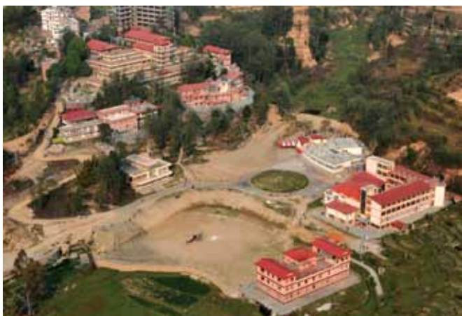
På bare 16 år er det centrale hospital vokset – udviklingen sker med forskellig hastighed over årene, men man står aldrig stille.