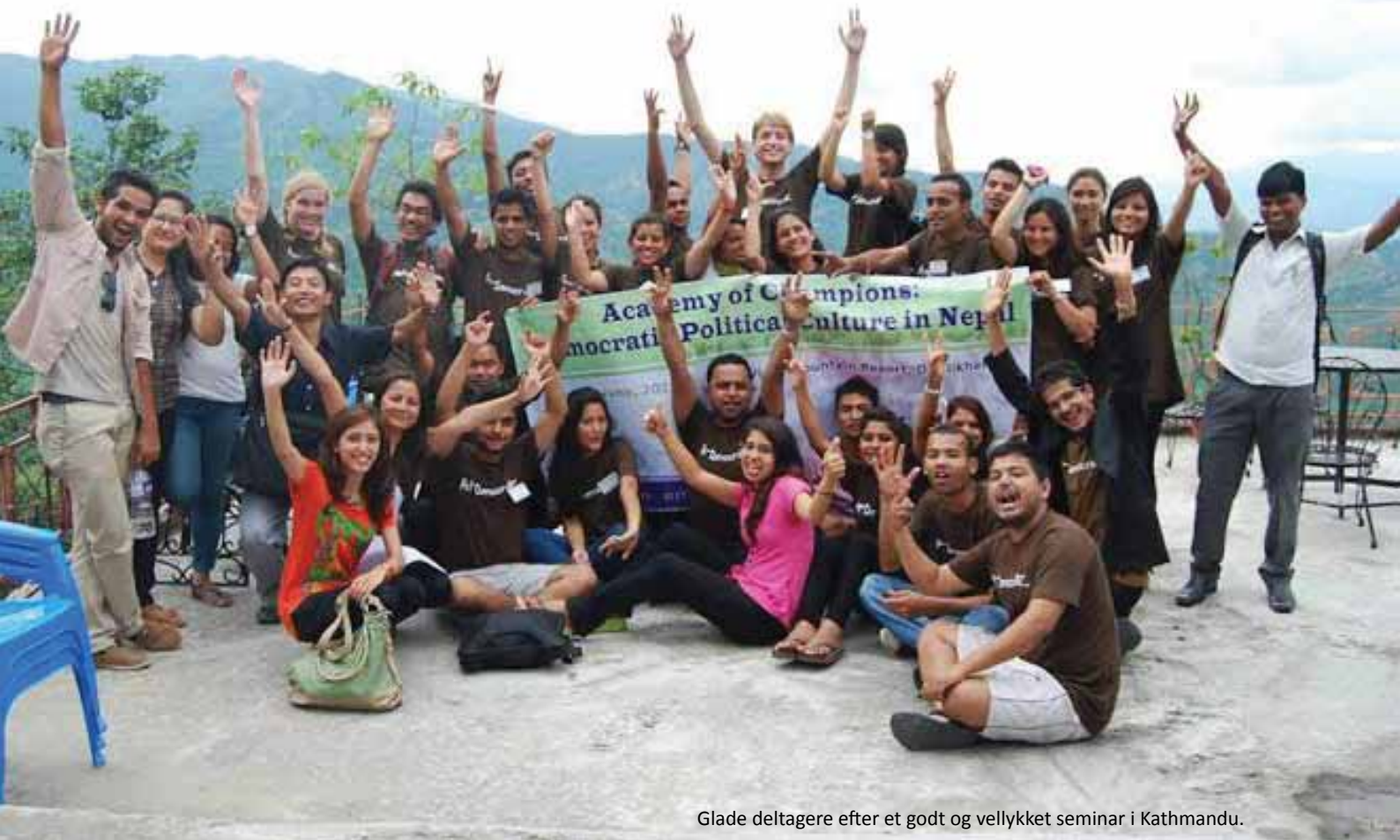
Glade deltagere efter et godt og vellykket seminar i Kathmandu.

Med afsæt i ovenstående ord har Radikal Ungdom i samarbejde med den nepalesiske NGO Youth Initiative netop afsluttet det DUF-støttede demokratiudviklingsprojekt Academy of Champions. 200 unge nepalesere er blevet uddannet i demokrati, samarbejde og dialog, og kompetencerne er videreført i 50 miniprojekter. Men hvordan arbejder man som ung på et udviklingsprojekt? Og hvad kan man egentlig udrette?