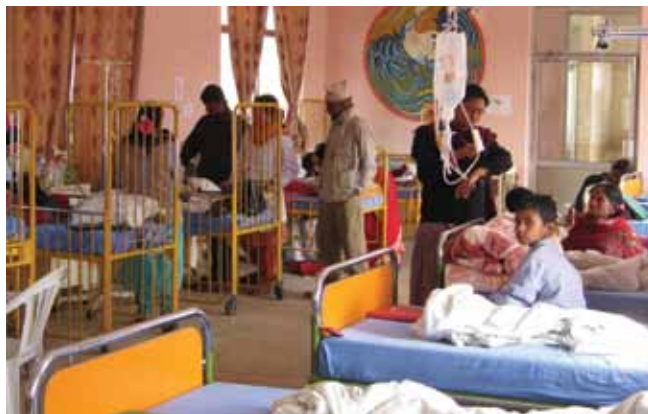
Stemning fra børneafdelingen. Forældrene – og børnene – mødes i øjenhøjde og med respekt.

Det sundhedsfaglige niveau på Dhulikhel Hospital er enestående i Nepal og tåler sammenligning med europæiske forhold. Alle, som henvender sig med et behandlingsbehov, bliver taget godt imod, undersøgt og modtager relevant behandling. Priserne for ophold og behandling er beskedne, ens for alle, og hvis man er uden midler, er der mulighed for at få gratis behandling via Dhulikhel Hospitals charity program.