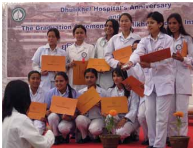
En gruppe stolte nyuddannede sygeplejersker. Uddannelse af kvalificeret personale er et bidrag til hele Nepals sundhedssektor.