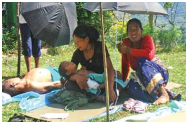
...og efter operationen kommer patienten til hægterne uden for i solen ....

Flere af outreach centrene er bygget af lokale folk med lokale materialer, så langt det har været muligt. De lokale aktiviteter omfatter ydelse af mikrolån og mikro-forsikringsordninger, bygning af børnehaver, restaurering af skoler, etablering af røgfri ovne, formidling af sundhedsviden via lokale nøglepersoner og grupper og i forbindelse hermed f.eks. træning i bedre dyrkningsmetoder.