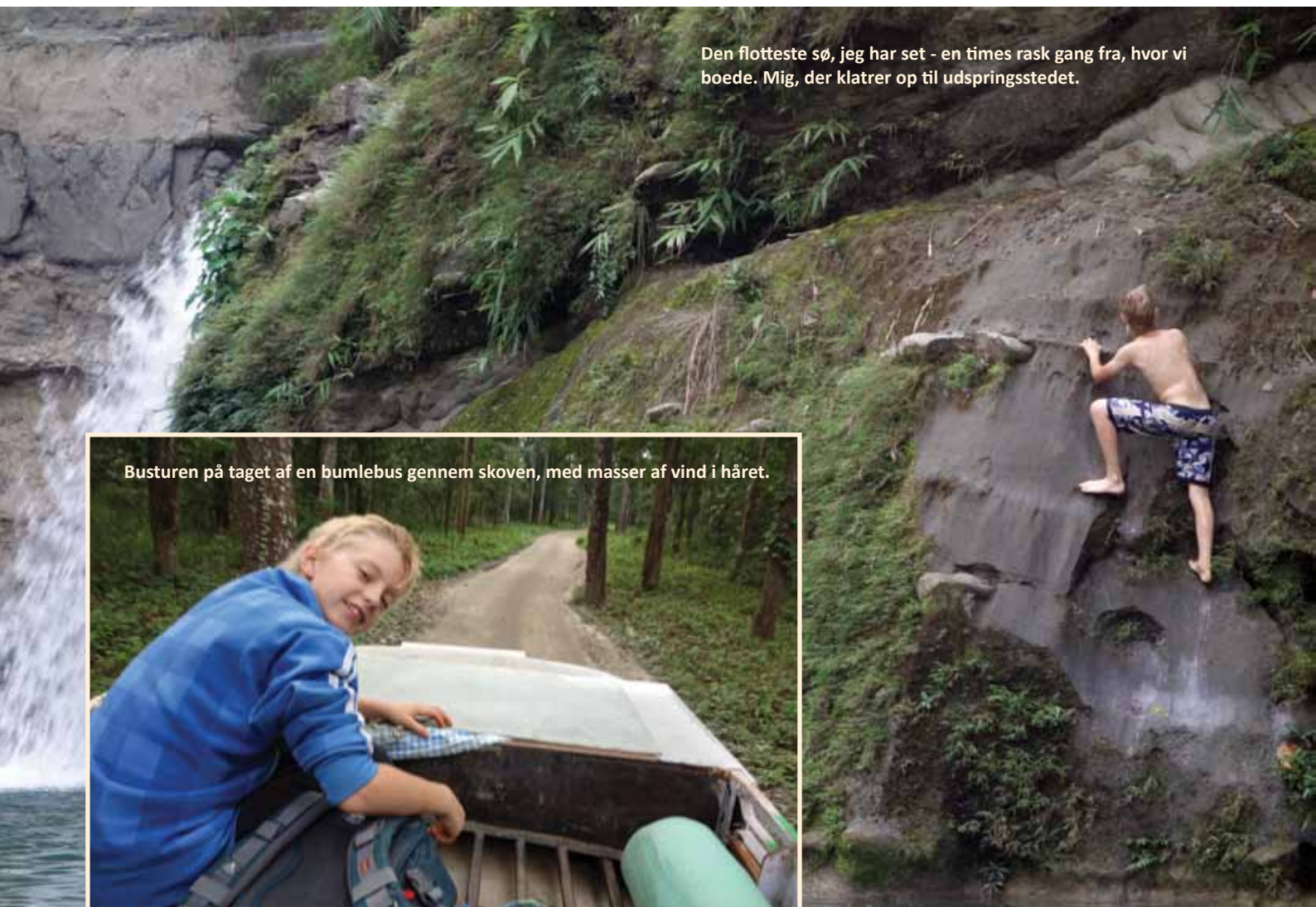
Busturen på taget af en bumlebus gennem skoven, med masser af vind i håret.