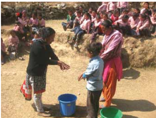
Generel forebyggelse i lokalsamfundet – ligesom i Danmark er det altid muligt at forbedre håndhygiejnen.

Dhulikhel Hospitals samarbejde med befolkningen i lokalsamfundene er altid forankret hos lokale ressourcpersoner eller grupper, som eksempelvis mødregrupper, kooperativer, skoler og lokale råd og forsamlinger.