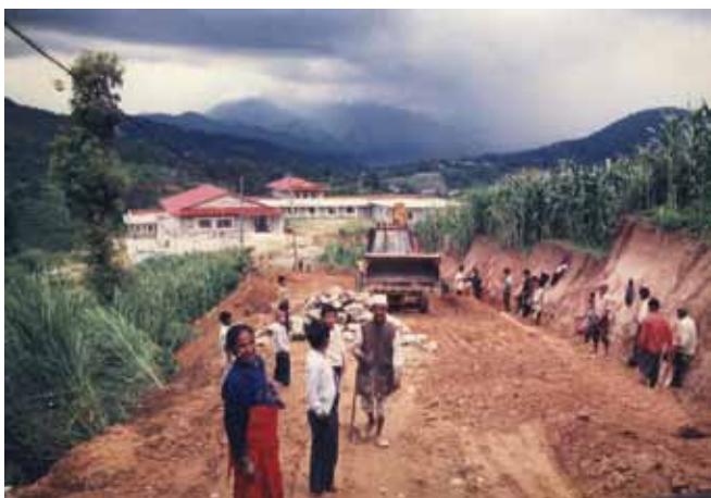
Hvor hospitalet nu ligger, var der marker. Fra begyndelsen har lokalbefolkningen været engageret – der skabes arbejdspladser.

Den 9. december 1996 er en lun, solrig vinterdag i Dhulikhel. Klokkeren 11.30 klipper Kong Birendra Shah snoren. Dhulikhel Hospital er åbnet. Forud er gået årelange forberedelser med fremskaffelse af finansielle midler, lokal opbakning og arealer. Foran ligger en stor opgave med at forbedre almindelige nepaleseres adgang til sund levevis og sygdomsbehandling.