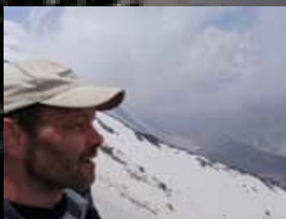
Tekst og foto: Martin Petersen

Vi fløj med en meget lille flyver fra Kathmandu til Lukla, som er udgangspunktet for alle bjergbestigningsekspeditioner til Everest og Khumbu-distriktet. Bare denne flyvetur var noget af en udfordring. Vi blev placeret i flyveren næsten oven på den bagage, vi havde med, og så gik det afsted mellem de mange bjergtoppe.