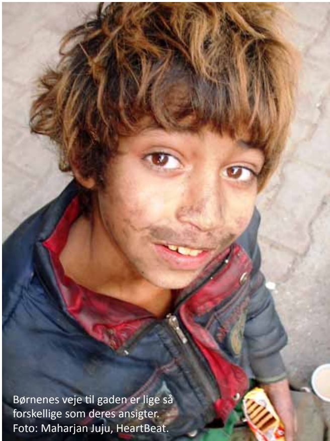
Børnenes veje til gaden er lige så forskellige som deres ansigter.

Gør en forskel: Hvis du ønsker at vide mere eller at gøre en forskel for Kathmandus gadebørn, kan du kontakte nogle af de mange organisationer, som arbejder langsigtet med at hjælpe gadebørnene væk fra gaden og ind i en tryk tilværelse. For eksempel driver organisationen CPCS flere drop-in centre i Kathmandu, hvor børnene hjælpes på rette vej, og organisationen HeartBeat driver gadekøkken-initiativerne Tea4Free og CurryWithoutWorry, hvor gadebørn bspises og får positiv social kontakt til voksne kontaktpersoner.