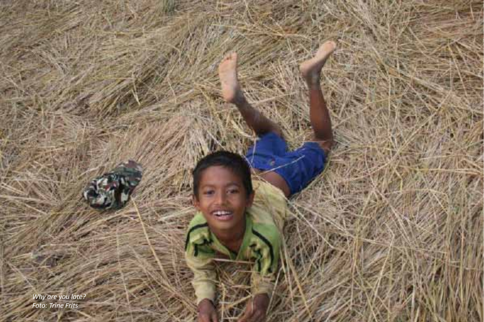
Why are you late?

hans yndlingsfarve åbenbart var 'pink'. "So not the blue colour? You like the pink colour more than the blue?". Tvivlende "yes" fra eleven. Skal vist lige lære af Winnie, hvordan man pakker sine forudindtagede kultur-, køns- og farvefordomme sammen og give drengen lov til at elske pink.