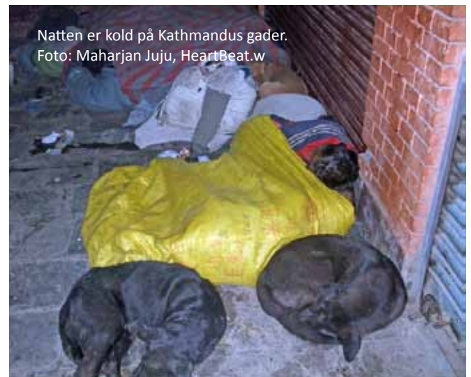
Natten er kold på Kathmandus gader.

Gør en forskel: Hvis du ønsker at vide mere eller at gøre en forskel for Kathmandus gadebørn, kan du kontakte nogle af de mange organisationer, som arbejder langsigtet med at hjælpe gadebørnene væk fra gaden og ind i en tryk tilværelse. For eksempel driver organisationen CPCS flere drop-in centre i Kathmandu, hvor børnene hjælpes på rette vej, og organisationen HeartBeat driver gadekøkken-initiativerne Tea4Free og CurryWithoutWorry, hvor gadebørn bspises og får positiv social kontakt til voksne kontaktpersoner.