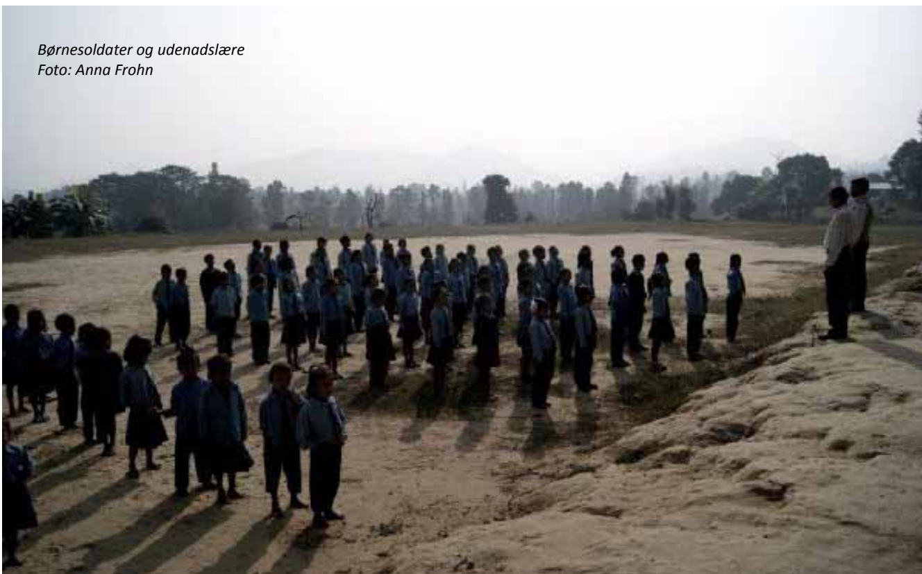
Børnesoldater og udenadslære