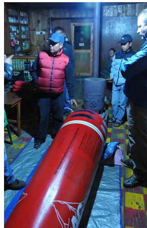
Ca. en time efter jeg var blevet vækket, blev jeg taget med nedenunder i spisestuen hvor jeg blev lagt i en gamow-bag.

Altså en meget langsommere opstigning, og her var der da heller ingen problemer med højden.