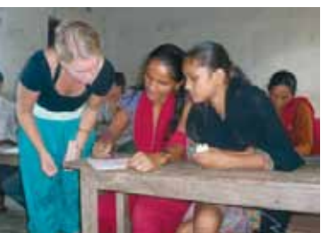
Teacher training på Ayodhyapur Skole, september 2010

Det skal handle om: Respekt, forståelse, globalisering for almindelige folk, græsrodsarbejde, fællesskab, styrke, grænseflytning - både her og der, tilfredsstillelse, inspiration, livsglæde, panderynker, udfordringer, hårdt arbejde, rådgivning, kommunikationsproblemer, kulturchock, svigt, skuffelser, venskab, tålmodighed, meningsfuldt arbejde og perspektiv. Læs mere: www.kantipur.dk .