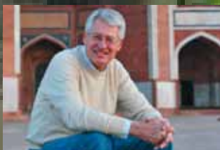
Skrevet af Finn Thilsted, tidligere ambassadør i Nepal Juli 2010

Fornylig besøgte jeg nogle flygtningelejre i Jhapa-distriktet omkring byen Damak ikke langt fra den indiske grænse i det østlige Nepal. Det var et meget positivt besøg, fordi stemningen blandt flygtningene var fuld af håb om en løsning på deres langvarige flygtningesituation.