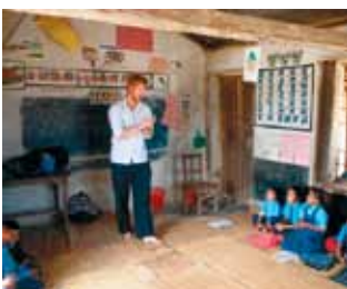
Syv uger i Kantipur flytter grænser for både danskere og nepalesere

danske netværk har tilbudt sin viden og erfaring i februar 2011. Det skal blive starten af et længere forløb med fokus på folkesundheden. Kvinderne i Ayodhyapur og Indrabasti blev i september spurgt, om de kunne tænke på et område, hvor den danske læge kunne gøre god gavn. Svaret kom prompte. Det skulle handle om kvinder og børn. Hvert 6. barn, der fødes i Nepal, dør, inden det fylder fem år. Så det er nok rigtig godt set af kvinderne. En mand fra Kantipur foreslog, at alle, der besøger den danske læge, betaler 10 rupies eller hvad de nu har råd til. Det skulle være starten på en opsparing til en sundhedsklinik. Jamen, det er da alle tiders idé. Lad os komme i gang. Vi danskere kunne da godt spytte lidt i den sparebøsse.