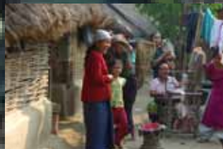
Livet i lejrene