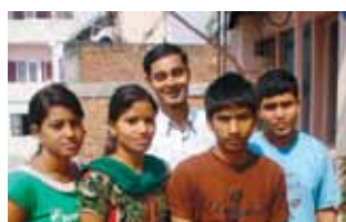
De fire unge til møde i Kathmandu om deres fremtidige uddannelsesstøtte

Nu, halvandet år efter start, begynder vi at kigge på disse, lidt mere velstillede familier. Og vi begynder at kigge på, om vi kan støtte uddannelse af landsbyernes unge. Ifølge foreløbige oplysninger er der omkring 25 unge fra andelsforeningen, der er i færd med at tage en uddannelse i Narayanghat, fire timers rejse eller 35 km borte. Kantipur udvalgte i februar 2010 de fire unge, to drenge og to piger, der burde være dem, der modtog den uddannelsesstøtte, som der var afsat midler til. En af pigerne er i gang med tage en bachelor i ledelse, to er på vej til at blive sundhedsassistenter, og en af drengene er startet på den dyre uddannelse til læge. Disse fire unges uddannelse støttes - et år ad gangen - med 50 %, under forudsætning at bestået eksamen kan dokumenteres, at der foreligger et skriftligt budget for udgifterne og at familierne betaler de andre 50 %. Uddannelse er guld, og det er meget vigtigt at bakke op om de unges uddannelse. Samtidig får de mere velstillede familier lidt af den opmærksomhed, de fortjener.