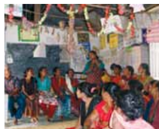
Møder i andelsforeningen, september 2010

ser ud til, at andelsforeningen er godt på vej mod målet: at løfte de tre landsbyer op over fattigdomsgrænsen inden udgangen 2013.