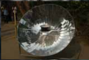
Solar kogeapparat der bruges af hele familien.