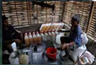
Uddeling af fødevarerhjælp