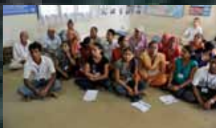
Sprogundervisning før afrejse til tredie land