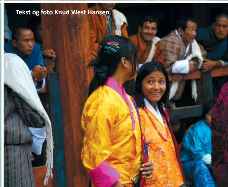
Tekst og foto Knud West Hansen

Men landet er altså stadig et af verdens fattigste, og der er mange, som trods alt nok ville sætte pris på en mere reel forbedring af levestandarden. Blandt andet dem, som Finn Thilsted beskriver i sin artikel