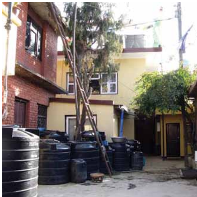
Gårdspladsen ved Dolmas hus.