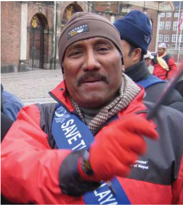
Nepals turistminister Sharat Singh Bhandari.