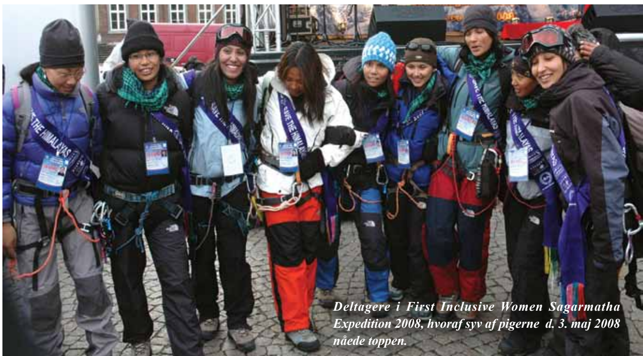
Deltagere i First Inclusive Women Sagarmatha Expedition 2008, hvoraf syv af pigerne d. 3. maj 2008 nåede toppen.