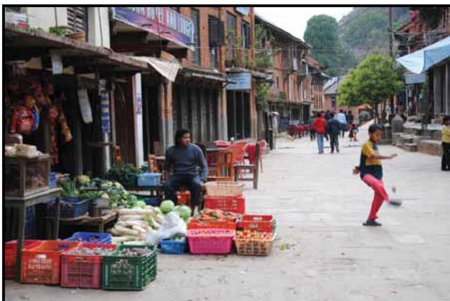
Hovedgaden i Bandipur