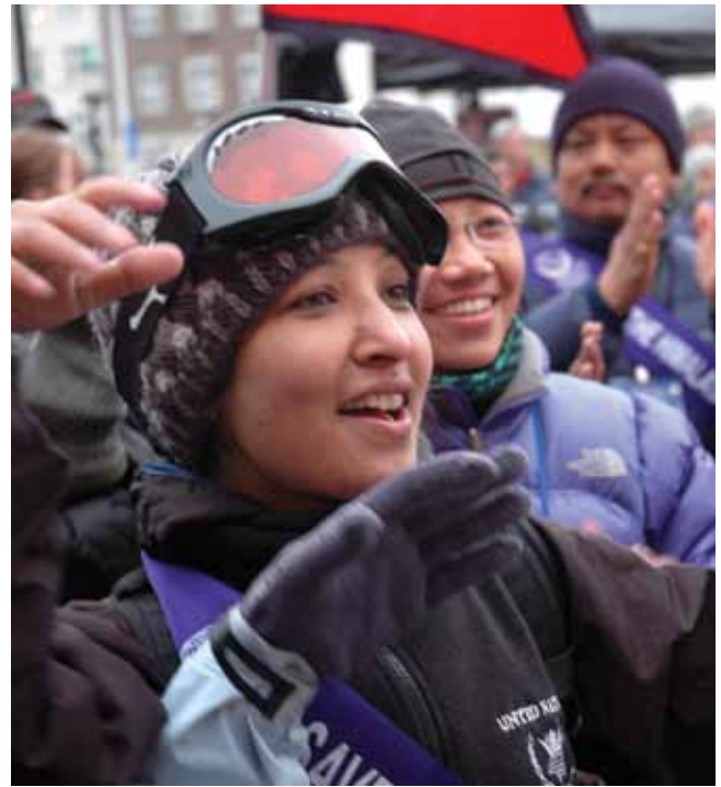
Sang og dans på slotspladsen.