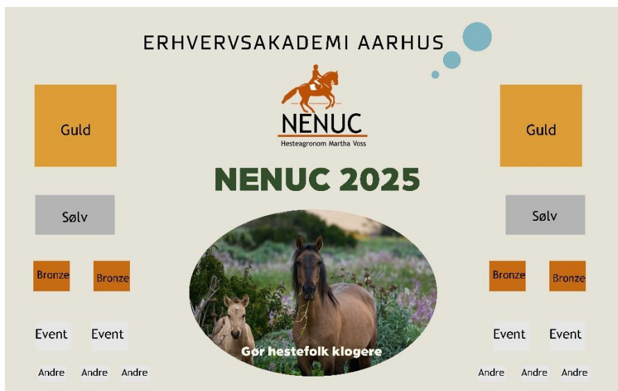
SKITSE AF PAUSE PRÆSENTATION PÅ STORSKÆRMEN.

Når vi har aftalt dit sponsorat og vilkårene herfor, sender vi dig en sponsoraftale og en faktura. Denne kan dateres til betaling i 2025, hvis det ønskes.