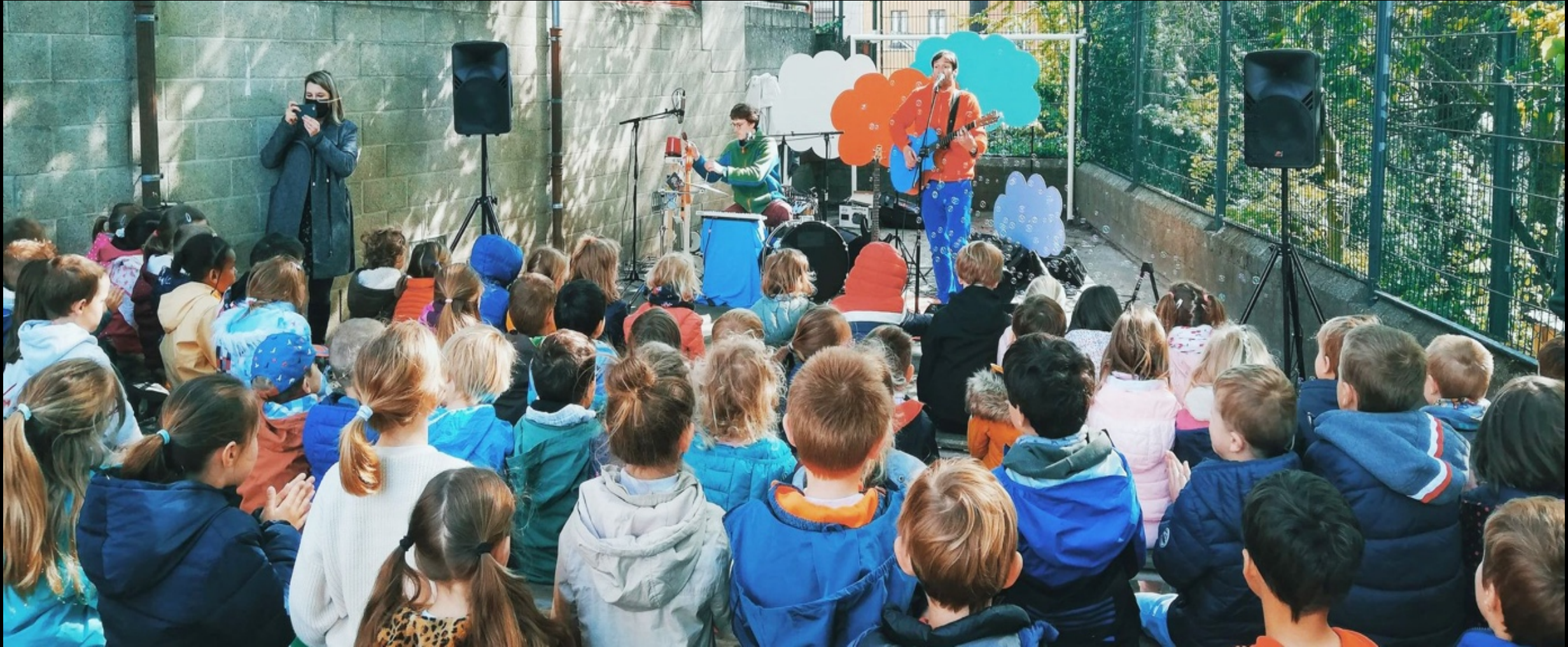
Centre culturel de Genappe, mai 2021